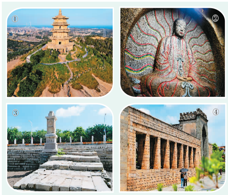
图1:泉州石笋万寿塔全景。 图3:泉州江口码头。