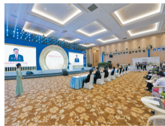
7月31日晚，第44屆世界遺產大會閉幕。

本次大會上，發達國家和發展中國家新增世界遺產大體均衡，多國跨境聯合申報和系列遺產類型實現增長；非洲國家新增2項世界遺產，「非洲優先」全球事項得到具體落實。大會還對200多項世界遺產保護狀況報告進行了審議，中國的長城、科特迪瓦的塔伊國家公園和科莫埃國家公園等3項遺產保護狀況成為世界遺產保護管理範例；剛果民主共和國薩隆加國家公園從《瀕危世界遺產名錄》中移除；英國「利物浦海商城」成為過去10年遭除名的首項世界遺產。