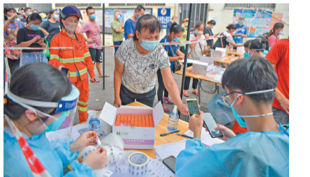
8月1日，海南省海口市，工作人員對確診病例曾去過的海口頭鋪農貿市場相關人員進行登記。

因應疫情，多地提醒「非必要不出省、不離市」。四川省1日要求全省各級黨政機關工作人員、國有企業事業單位員工帶頭，非必要不離川，並暫緩組團跨省旅遊。廣東省亦要求，不得組團到中高風險地區旅遊，近期暫停組團赴湖南或其他出現病例的區域旅遊等。