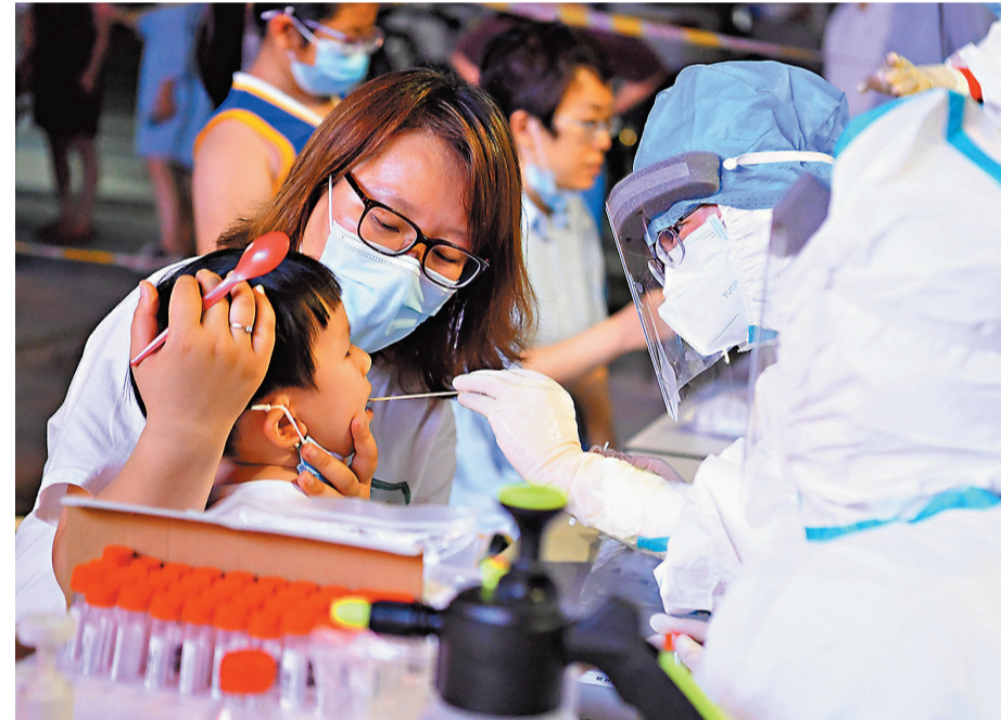
鄭州市二七區京廣路街道春暉社區疫情風險等級調整為高風險地區。7月31日晚，鄭州市二七區開展全員核酸檢測。