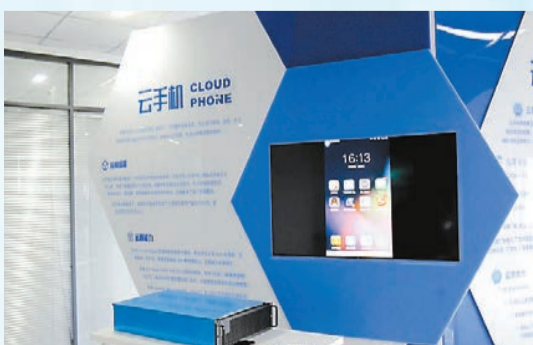
湖南微算互聯信息技術有限公司已成為國內最大的雲手機廠家