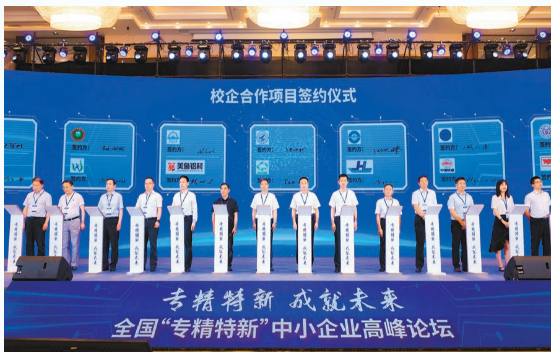
校企合作項目簽約儀式

除了發布「專精特新」中小企業的發展成果及相關政策，參會嘉賓的頭腦風暴同樣讓論壇熠熠生輝。「專精特新」的靈魂是創新。未來如何更好地助力中小企業創新？國務院發展研究中心學術委員會副秘書長馬駿指出，企業創新面臨技術、市場、政策的不確定性，加上企業認知的局限，進而面臨諸多創新風險，所以需要政府部門和社會給予大力支持，要制定鼓勵性政策，幫助他們降低風險。馬