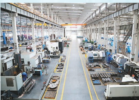
南方閩門水錘防護產品銷量長期位居行業第一