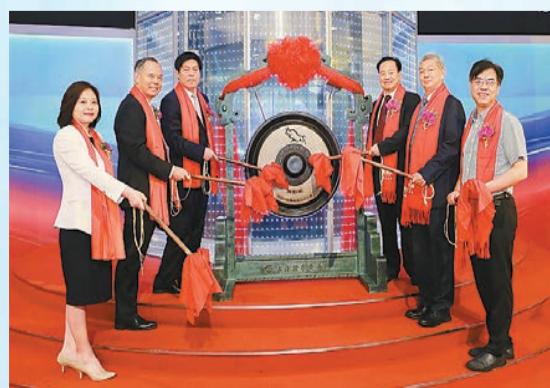
愛威科技成功登陸科创板