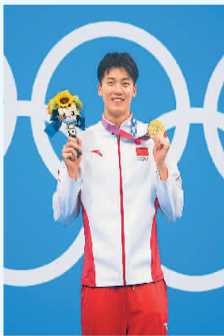
汪顺在颁奖仪式上。