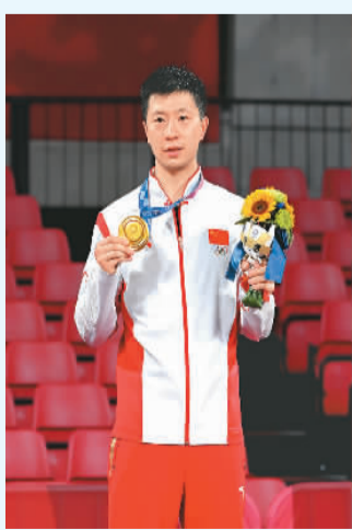
马龙在颁奖仪式上。