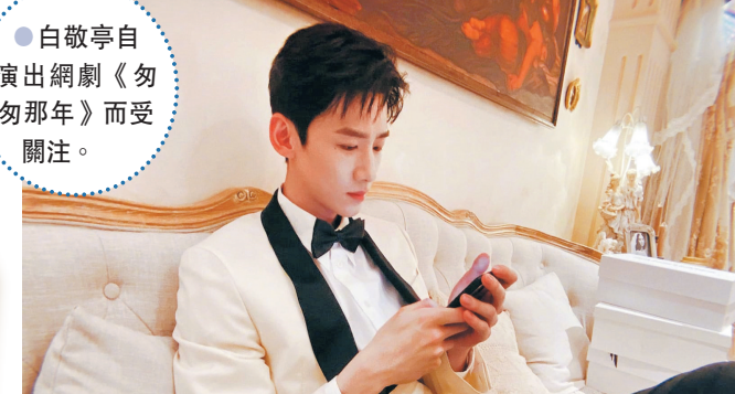
白敬亭自演出網劇《匆匆那年》而受關注。