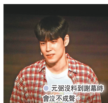
元弼沒料到謝幕時會泣不成聲。

Kei：「劇裏面遇到好多親切嘅演員，台前幕後嘅工作人員，度過了幸福的時間。希望大家都記住這幸福的感覺，並請大家繼續支持我。」