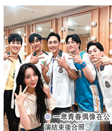
一眾青春偶像在公演結束後合照。