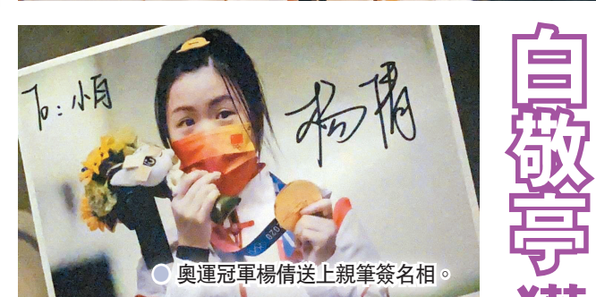
奧運冠軍楊倩送上親筆簽名照。