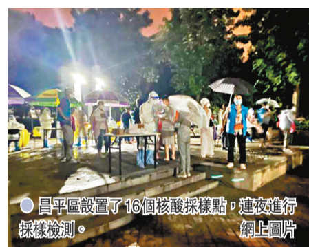
昌平區設置了16個核酸採樣點，連夜進行採樣檢測。

張文宏強調，注射疫苗後可以有人感染，像這次南京、上次廣州，都有不少人關注注射疫苗後感染。但如果不打疫苗，感染的人數可能會更多。「南京疫情讓我們再次看到病毒的無時不在。不管我們願意不願意，未來的風險一直會有。」張文宏表示，此次南京新冠疫情促使全中國經受壓力測試，為未來疫情防控提供更多思考。中國需要長期與病毒共存智慧。