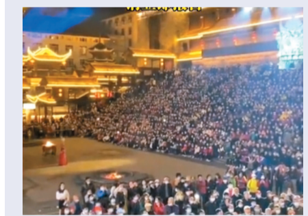
張家界魅力湘西劇場約2,000名觀眾成高風險人群。

27日，成都也報告有一家三口確診，3人無南京旅居史，但在7月20至22日在張家界等地遊玩，7月23日、24日在常德市旅遊，3人在常德的一位密接者也在27日診斷為無症狀感染者。