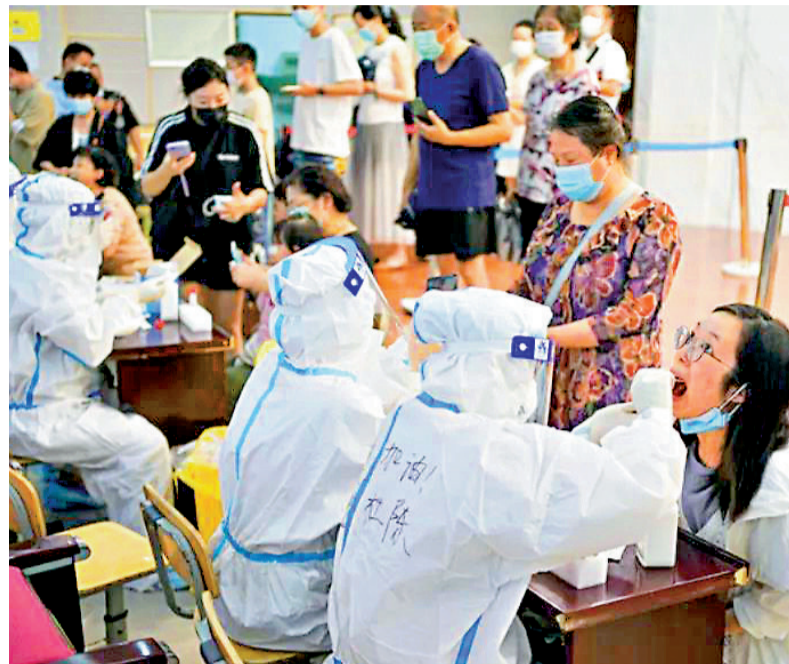
南京市28日新增本土新冠肺炎確診病例18例，目前全市累計報告本土確診病例已達171例。圖為7月25日，市民在南京市建邺區興隆街街道香山山路社區核酸檢測點接受核酸檢測。