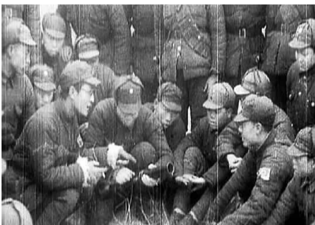
八路军在学习操作掷弹筒。