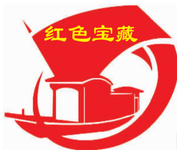
国家文物局特别支持

“你是谁，为了谁，我的兄弟姐妹不流泪”，一曲《为了谁》，唱出了中国人民解放军为国家为人民英勇无畏、坚强不屈的崇高精神，也诠释了人民群众对人民子弟兵的感激之情和军民团结的鱼水深情。