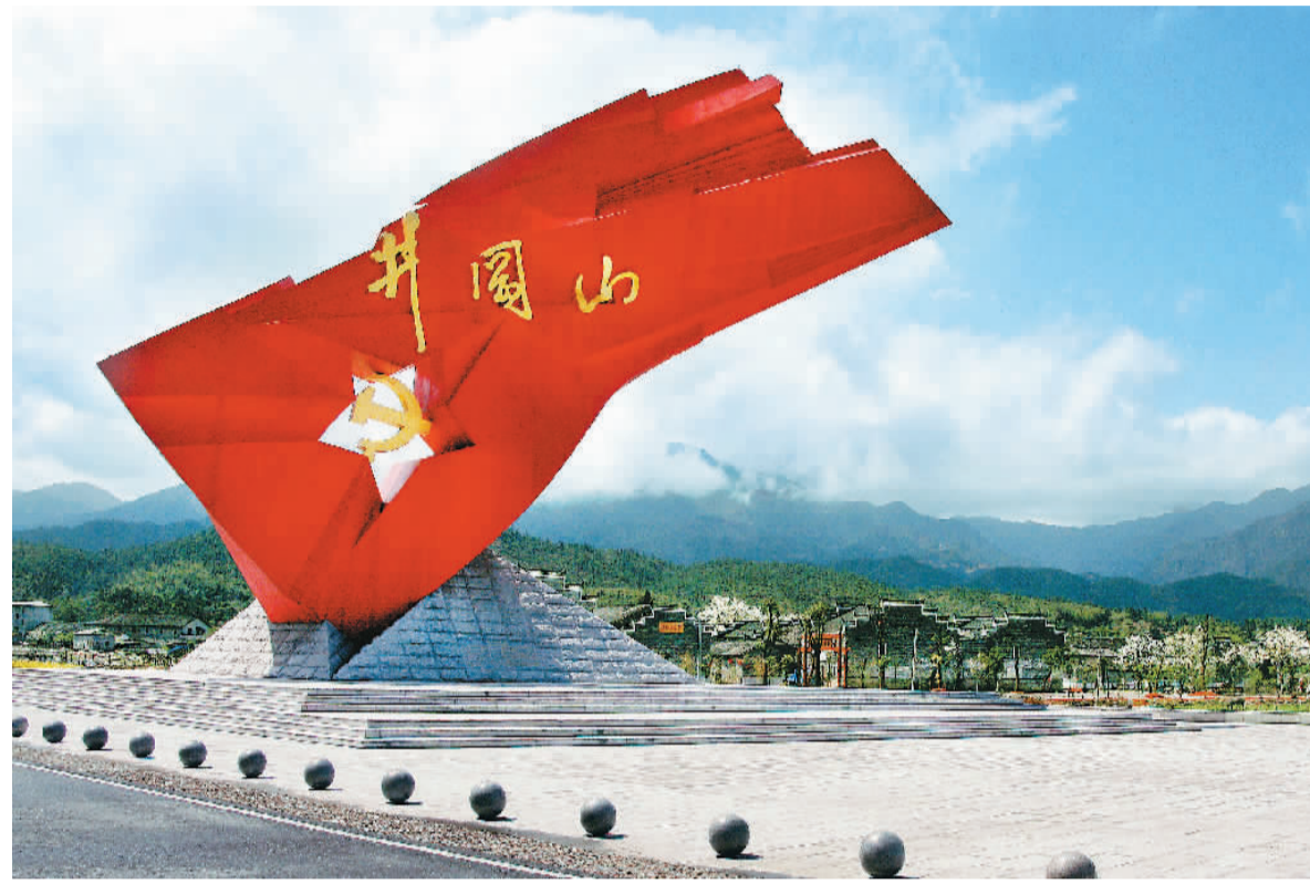
“井冈红旗”巨型雕塑。