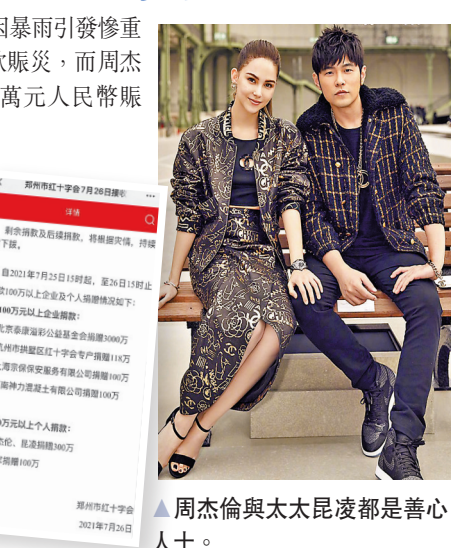
周杰倫與太太昆凌都是善心人士。

香港文匯報訊 河南近日因暴雨引發慘重災情,各地藝人紛紛行善捐款賑災,而周杰倫與太太昆凌也低調捐出300萬元人民幣賑災。