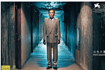
《白色大廈》為導演 Kavi Neang 首部劇情長片。

香港文匯報訊(記者 文芬)第78屆威尼斯國際電影節公布各單元入圍影片名單,由內地著名導演賈樟柯監製的柬埔寨電影《白色大廈》(White Building)入圍地平線競賽單元。該片是柬埔寨導演 Kavi Neang 的第一部劇情長片,也創歷史地成為首部入選威尼斯電影節官方單元的柬埔寨影片。