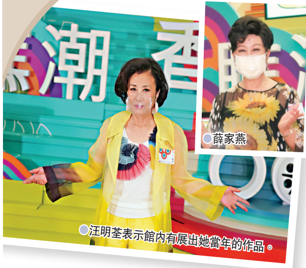
汪明荃表示館內有展出她當年的作品。