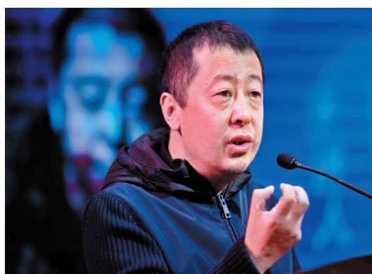
導演賈樟柯監製的柬埔寨電影作品進軍威尼斯影展。