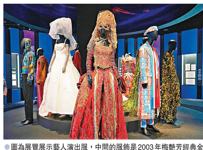
圖為展覽展示藝人演出服,中間的服飾是2003年梅艷芳經典金曲演唱會開場服飾。

而每一個年代她都有份。縱橫演藝界逾半世紀的家燕姐見證新人輩出,她認為成功除要有天分、毅力,還要捱得苦才有成就。家燕姐又透露很開心在活動上見到其學生鍾柔美,她笑言因為有其他學員在場,不好意思只攬她一個。問到家燕姐的才藝中心會否自捧一隊女團?家燕姐坦言:「好想,但我又好注重佢哋學業,今期都有兩個學員唱跳好叻,但家人想佢哋去外國留學,我都唔想阻佢哋前途。」家燕姐坦言原本計劃組女團的年齡是17至18歲,但現在要提前到13至14歲。她又透露最近多了很多人去才藝中心報名,最細的更只得四五歲。問到她可有推薦學生參加第二屆《聲夢傳奇》?她表示沒有,但知道有學生參加,覺得參加不一定成功,但可以攞到經驗。