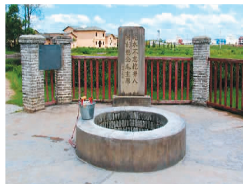
瑞金沙洲坝红井旧址。