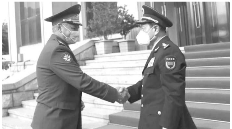
7月28日，国务委员兼国防部长魏凤和在杜尚别与出席上海合作组织成员国国防部长会议的俄罗斯国防部长绍伊古举行会谈。