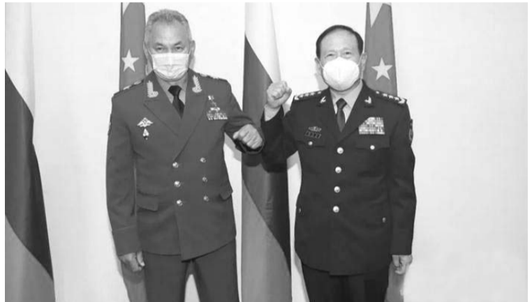
7月28日，国务委员兼国防部长魏凤和在杜尚别与出席上海合作组织成员国国防部长会议的俄罗斯国防部长绍伊古举行会谈。

美关系，中方的态度非常明确，美方应树立客观正确的对华认知，选择与中方相向而行，相互尊重，公平竞争，和平共处，推动中美关系健康稳定发展。