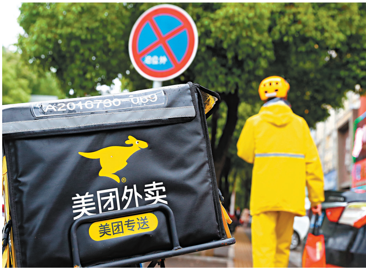
●科網巨頭26日股價大舉下跌，新經濟股爆發小股災，美團股價大跌13.76%。