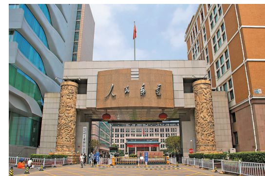
●工信部發文啓動專項整治行動，市監總局等亦發文維護外賣送餐員權益。圖為工信部。