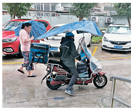
●上海颶風天還在派送的騎手。