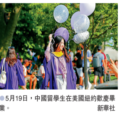
5月19日，中國留學生在美國紐約歡慶畢業。

「美全政府全社會動員，全方位遏制中國，似乎只要遏制住中國的發展，美內外難題就能迎刃而解，美國將重新變得偉大，美國治下的霸權就可以延續。美方動輒拿中方說事，好像不扯上中國，都不會說話做事了。我們敦促美方改變當前這種極其錯誤的思維和極其危險的對華政策。」謝鋒指出。