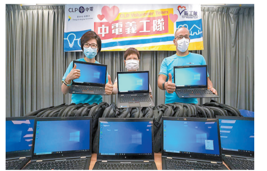
中電捐贈二手電腦給基層家庭學童以支援學習需要。

【香港商報訊】記者唐信恒報導：新冠疫情持續超過一年半，電子學習混合課堂模式，已成為教育新常态。中華電力分別透過香港單親協會和香港電腦學會捐贈100部性能良好的二手手提電腦給有需要的基層家庭，支援基層學童的電子學習需要，並由中電義工為家長及子女提供培訓，以縮窄「數碼鴻溝」。