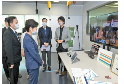
林鄭月娥昨日到訪香港教育大學。圖為她聽取該校研發的方格樂譜介紹。

林鄭月娥說：「我樂見教大積極推動教員和學生透過創新科技和發揮創意，將知識和學術研究成果轉化，應用於教育和社會。教大研發的項目不乏在公開比賽或國際大賽中獲獎，亦有項目已被應用在教育和其他範疇，令學生和公眾受惠，成績令人鼓舞。」