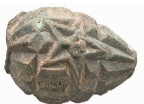
贵州习水青杠坡战斗遗址发现的红军手雷。

今年以来，江苏连云港海州区检察院加强海州古城等历史文化遗址的保护，积极开展文化遗产保护领域公益诉讼专项行动，建设公益诉讼线索数据库，研发“网格化+古城保护”功能模块，实时收集文物毁损、古城违规改造等公益诉讼线索。同时，探索检察院、文化体育和旅游局、住建局等部门联合巡查、联合督查、联席会议的“三联”工作机制，组建文物保护“四支队伍”，构建起立体式文物保护体系。