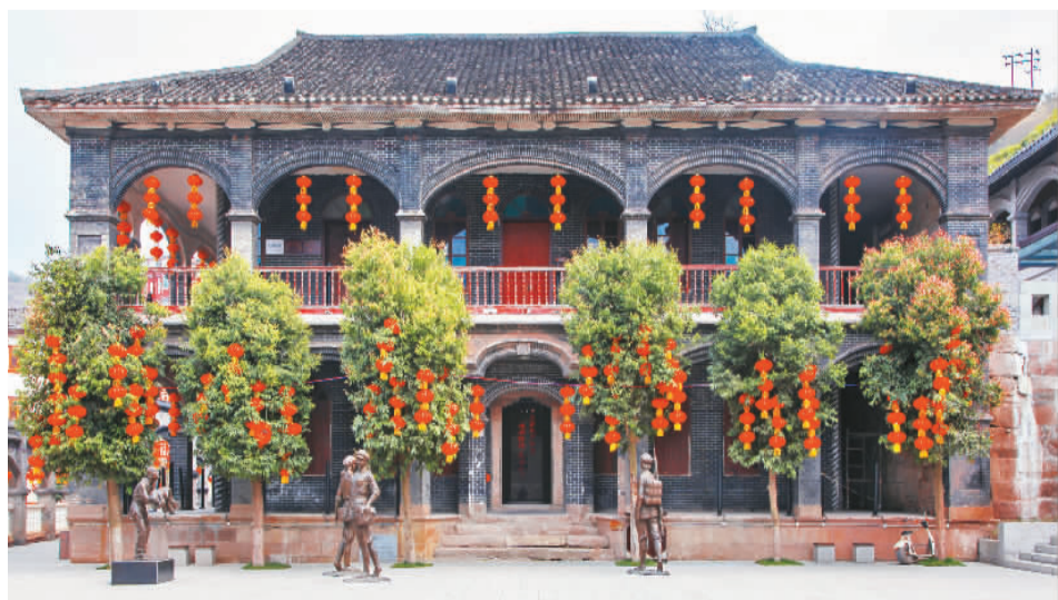
中国女红军纪念馆。

站在四渡赤水纪念馆的观景长廊，朝不远处山头上眺望，只见一块写有“土城渡口”四个鲜红大字的纪念碑威武耸立。86年前，红军就是从