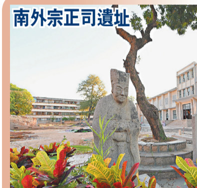
南外宗正司遺址 南外宗正司是遷居泉州的宋代皇族群體的管理機構。南外宗正司的設置,進一步強化了國家政權對泉州海洋貿易的推動,體現了強有力的官方管理保障。遺址目前已考古發現兩處建築基址、一處水岸設施、一處沿岸道路,出土建築構件、瓷片等文物。