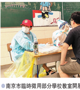
●南京市臨時徵用部分學校教室開展第二輪全員核酸檢測。

首現2重症 次輪採樣超74萬 南京市26日上午召開新聞發布會,通報疫情防控制最新情況。截至25日24時,南京累計報告本土確診病例75例,本土無症狀感染者13例。其中首次出現2例重症病例。25日上午起,南京對全市常住人口、來寧人員開展第二輪全員核酸檢測,截至當日24時,共採樣7,434,623人份。這是南京本輪疫情爆發以來,首次