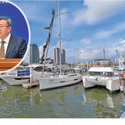
●圖為三亞鴻洲國際遊艇會碼頭。

香港文匯報訊 綜合報道:26日,國新辦就海南自由貿易港跨境服務貿易負面清單有關情況舉行發布會。中國商務部副部長兼國際貿易談判副代表王受文(圖)當日表示,《海南跨境服務貿易負面清單》(下稱《清單》)是國家在跨境服務貿易領域公布的第一張負面清單,明確列出針對境外服務提供者的11個門類70項特別管理措施,其中包括允許境外個人申請開立證券賬戶或者期貨賬戶。