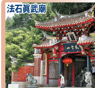
法石真武廟 真武廟,位於豐澤區法石村石頭街,始建於宋代,是祭祀海神真武大帝的廟宇。距今已有一千多年歷史了,有「小武當」之稱。法石真武廟依山面海,東邊便是舉世聞名的古刺桐港,廟中有千年古榕數株,現存明清建築,是泉州宋元時期海上絲綢之路東端具有說服力的歷史見證。