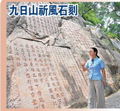
九日山祈風石刻 九日山祈風石刻為上次申報時的16個遺產點之一,其記載了航海祈風的祭祀儀式,反映了當時海上航行存在的不確定性。本遺產點包括10方完整記錄的石刻,最早的可追溯至1174至1266年間,反映了一年不同季節的航海傳統。