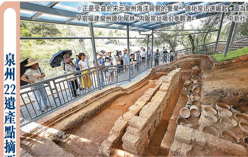
正是受益於宋元泉州海洋貿易的繁榮,德化窯迅速崛起。圖為早前福建泉州德化尾林二內廠窯址吸引參觀者。 泉州22遺產點摘要 22處代表性古蹟遺址包括:九日山祈風石刻、市舶司遺址、德濟門遺址、天后宮、真武廟、南外宗正司遺址、泉州府文廟、開元寺、老君岩造像、清淨寺、伊斯蘭教聖墓、草庵摩尼光佛造像、磁灶窯址、德化窯址、安溪青陽下草埔冶鐵遺址、洛陽橋、安平橋、順濟橋遺址、江口碼頭、石湖碼頭、六勝塔、萬壽塔。 整理:香港文匯報記者 何德花

事實上,在西方「發現」東方之前,中國已經有了一種基於貿易和商業的世界眼光。今次「泉州:宋元中國的世界海洋商貿中心」申遺成功,亦再次實證了古代中國與世界各國文化交流互鑒的輝煌歷史和傳統信念。