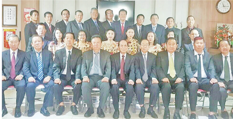
酒水金门会馆理监事们

千品学兼优的为印尼国家建设服务的人才。他功崇德钜,不愧是一位具有远见卓识的成功企业家,是印尼华社楷模。资助北京燕京华侨大学建校和办学的事迹,在侨界、民办教育界早已传为佳话。