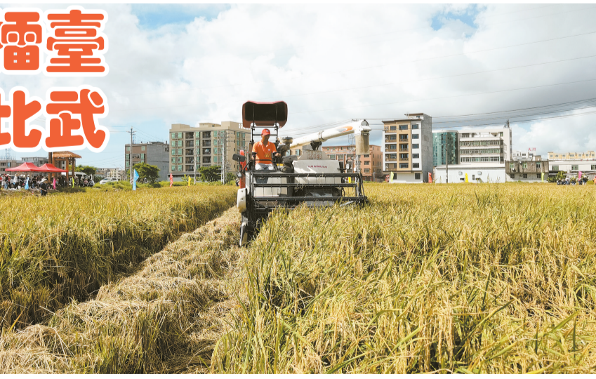
圖為選手在比賽中駕駛收割機

【汕頭日報訊】7月12日上午，烈日炎炎，潮陽省級絲苗米產業園順全產業鏈科技示範中心田地稻浪滾滾，豐收在望。一場由省農業農村廳主辦的廣東省“弘科杯”水稻機收減損技能大比武(汕頭賽區)活動在這裏火熱上演。