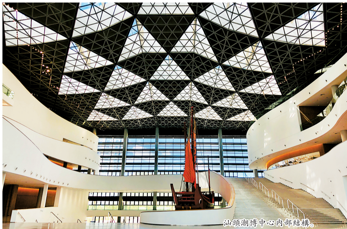
汕頭潮博中心內部結構。

為大力推進汕頭市歷史文化保護和利用工作，2020年底，汕頭市謀劃推出了“八個一批”共45個歷史文化保護利用重點項目。目前，“八個一批”45個項目已啓動42項，完成