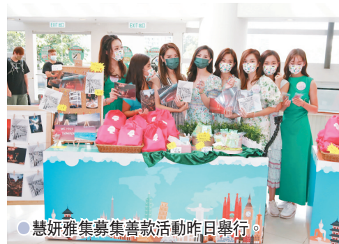
● 慧妍雅集籌集善款活動昨日舉行。