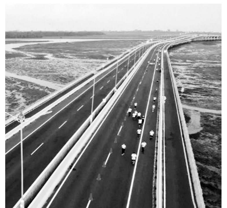
巴厘高速路车流下降76% 根据高速公路管理公司(Jasamarga)的记录,巴厘岛曼达拉(Mandara)高速路在2021年上半年的车子流量减少76%。