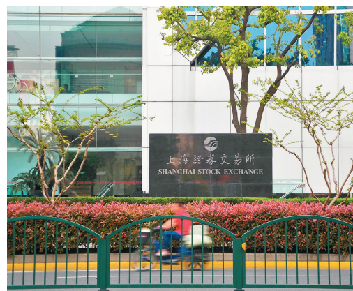
●滬綜指21日收報3,562點，漲25點。資料圖片

源達分析，從市場短期趨勢看，鋰電池板塊強勢爆發，極大程度提升了市場資金活躍度，有助進一步刺激科技成長股行情延續，創業板指短線有望延續震盪向上格局；而滬綜指在3,562點一線收盤後，後市能否放量突破該點位，將取決於權重指標藍籌股表現，這也將決定指數能否繼續向上反彈，否則滬指仍將在3,500至3,560點區間震盪。