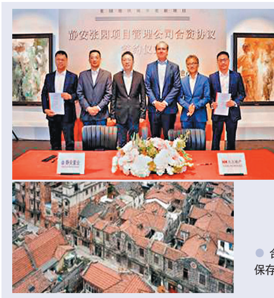
●上海市靜安區政府、上海靜安置業集團及太古地產的領導出席靜安張園項目管理公司合資協議簽約儀式。

石庫門保存 升級時尚聚集地 張園的歷史悠久，商人張叔和於1882年取得張園的業權並進行擴建，使之成為一個現代的公眾聚集地。由1885年對公眾開放至二十世紀初，張園一直被視為上海最知名的文化娛樂活動場所。這裏是上海最早對市民開放的遊樂場，並成為展覽、戲劇、魔術表演、休閒活動、聚會、演講、社交和餐飲的熱門場所。