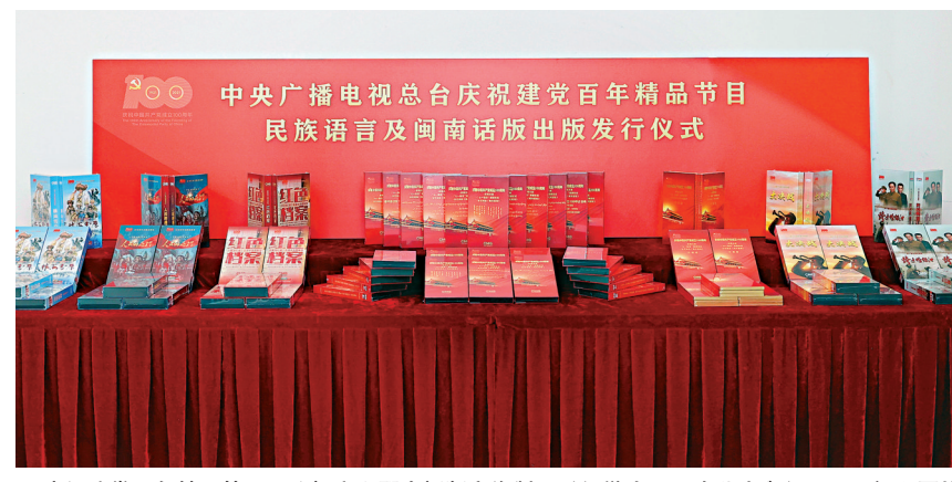
慶祝建黨百年精品節目民族語言和閩南話版音像製品發行儀式21日在北京舉行。 網上圖片

據介紹，慶祝建黨百年精品節目民族語言及閩南話版音像製品將於近期在全國近百家省市級新華書店、音像商城和網絡電子商城上線銷售。中國國際電視總台還將為黨政機關、企業事業單位、院校、社會團體、博物館、紅色旅遊地等定製相關產品。截至目前，中國國際電視總台已傾力打造了32種慶祝建黨百年主題出版物，涵蓋普通話、粵語、閩南話、五種少數民族語言以及多種外語。