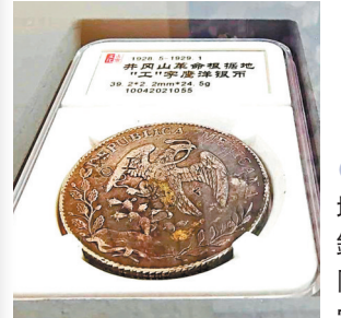
革命根據地的第一種銀元——井岡山「工」字銀元。

據悉，「工」字銀元直徑39毫米，厚2.2毫米，重27.58克，銀質含量達到99%，深受人民群众的歡迎，在井岡山革命根據地內外廣泛流通使用。不僅幫助紅軍渡過了艱難困難的歲月，同時亦進一步擴大了井岡山革命根據地的政治影響。