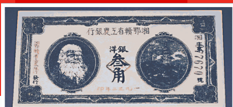
「湘鄂贛省工農銀行」發行的貨幣。