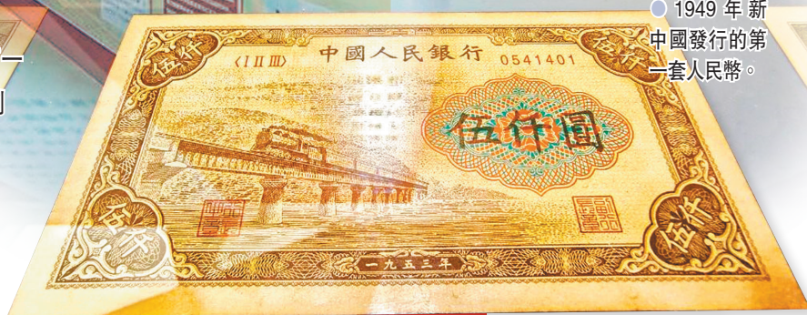
1949年新中國發行的第一套人民幣。

據介紹，紅色貨幣是新中國成立前中國共產黨領導的紅色政權發行的各種貨幣的統稱，是革命戰爭時期中國紅色政權的經濟生命線，是中國人民前仆後繼、流血犧牲、可歌可泣的革命史的見證，記載了中國共產黨金融事業與政治文化的發展。紅色政權先後建立過404個貨幣發行機構，發行過7種材質的514種貨幣，是中國貨幣史上濃墨重彩的一筆。