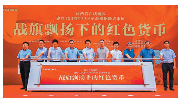
「戰旗飄揚下的紅色貨幣」主題展覽日前在陝西開展。

本次展覽分為第一次國內革命戰爭時期、第二次國內革命戰爭時期、抗日戰爭時期和解放戰爭時期四大部分，共展出紅色貨幣340種，展現1921年至1949年，中國共產黨領導的紅色金融事業發展壯大的奮鬥足跡，其中90%藏品是第一次公開展出，由全國22個省43個市（縣）的60多位收藏家提供。此次展覽也是發揮革命文物在黨史學習教育、革命傳統教育、愛國主義教育等方面的一次創新探索，引領大家從紅色金融歷史中汲取砥礪前行的磅礴力量。