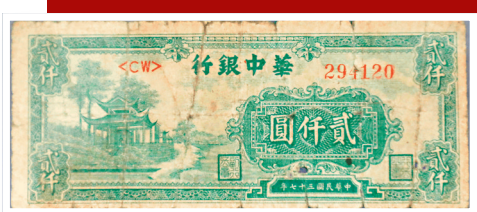
「華中銀行」發行的貨幣。