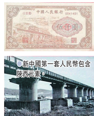
新中國第一套人民幣包含陝西元素。

特別值得一提的是，展覽還展出了一枚包含灃西元素的貨幣。這枚紙幣是一張面值伍仟圓的紙幣，主題圖案為隴海線渭河鐵路大橋，而這座橋的南端便是現在的灃西新城王家莊村。這也是1949年新中國發行的第一套人民幣，對統一全國各解放區的貨幣、支持人民解放戰爭的全面勝利和建國初期的經濟恢復，都曾發揮了重要作用。