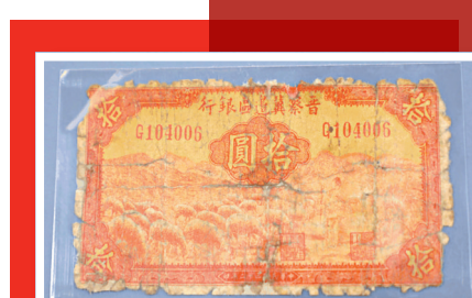
「晉察冀邊區銀行」發行的貨幣。