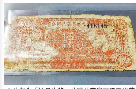
被譽為「抗日先鋒」的陝甘寧邊區延安光華商店代價券。

為了找零的需要，邊區政府本着既獨立自主又維護統一戰線原則，自行發行元以下的輔幣。「在當時的歷史條件下，邊區政府不便以銀行的名義發行貨幣，只得由延安光華商店的名義發行元以下的代價券。」延安光華商店代價券以商店名義印製創解放區貨幣之先河，非常有戰時特色。