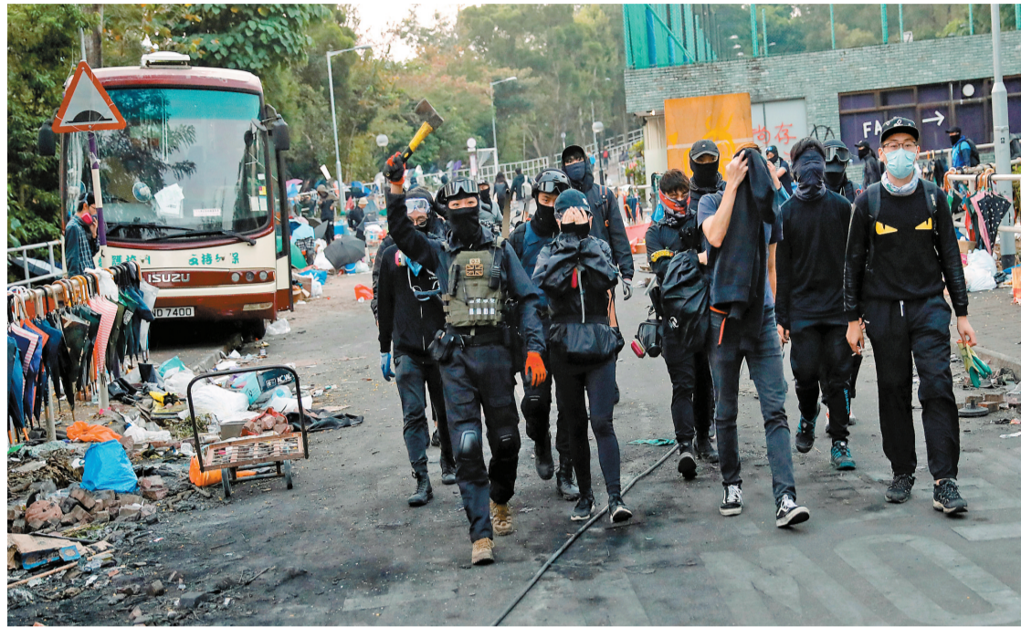
2019年11月，中文大學2號橋爆發衝突前大批蒙面黑衣人佔據，有人更手持斧頭。資料圖片

【香港商報訊】記者萬家成報道：多名涉前年修例風波案件的被告昨日被判刑重囚，其中2名涉及前年香港中文大學2號橋衝突的大專生，經審訊後裁定暴動罪及在非法集結中使用蒙面物品罪罪成，分別被判囚4年6個月及3年9個月。3名男女在同年沙田港鐵站包圍警員、投擲雜物及衝擊控制室，分別被判入獄12至45個月不等。另有1名倉務員被警方檢出汽油彈及汽油，他早前認罪，昨被判囚5年。