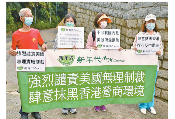
「新年代」成員昨持橫額到美領館抗議。