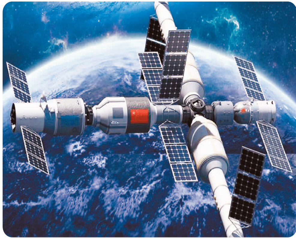
中国空间站将在建成后在轨运行效果图。

通过画面人们看到，空间站天和核心舱机械臂稳稳地托举着航天员移动至目标位置，那种灵活、轻盈的姿态让人不禁联想到古老传说中徜徉宇宙的飞天。通过媒体平台播出的有关部门制作的科普视频资料，人们可以全方位了解核心舱机械臂的超强性能，感受到正在建设中的中国空间站十足的智能范儿。