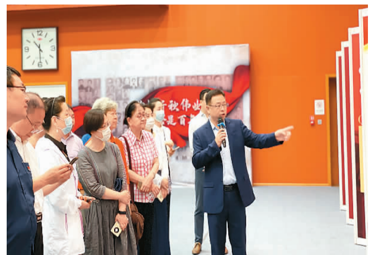
“恰同学少年——留苏档案见证百年复兴路”主题展在京开幕式上，与会嘉宾正在观展。

“恰同学少年”主题展由欧美同学会、中共上海市委统战部、上海市档案局(馆)、上海市欧美同学会(上海市留学人员联谊会)主办，欧美同学会留苏分会承办。据悉，本次主题展览资料的收集工作历时两年多，征集活动得到了全国留苏老学长以及社会各界人士的积极响应。展览分为“求索”“奋斗”“报国”3部分，展出了从全国各地征集的实物档案180余件、图片及文献档案400余件。