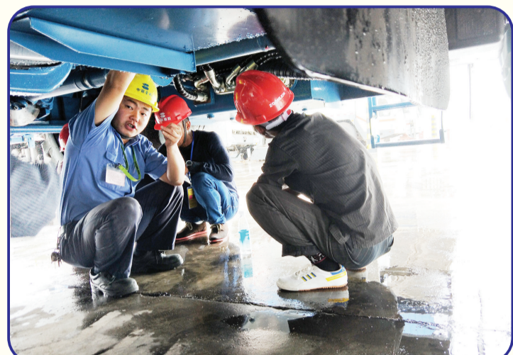
2017年7月,中国实施东帝汶大型机械操作手机培训项目,图为中方专家为学员讲解车辆底盘构造。