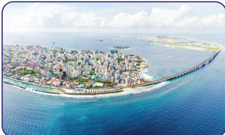
2014年9月,国家主席习近平对马尔代夫进行首次国事访问,两国领导人就建设中马友谊大桥达成共识。中马友谊大桥是中马共建“一带一路”的标志性项目,该项目连接马尔代夫首都马累和机场岛,主桥全长760米,于2018年8月完成竣工验收。