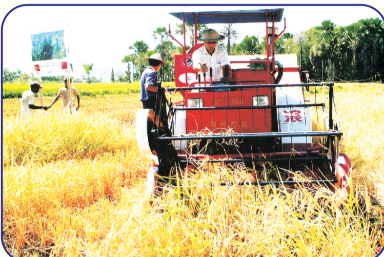
2008年1月,中国派遣专家赴东帝汶开展杂交水稻示范项目合作。经过中国农业专家两年的精心管理,示范田水稻产量比当地高出数倍。