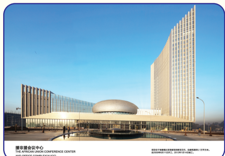
中国援非盟会议中心项目位于埃塞俄比亚首都的斯亚巴,总建筑面积5.1万平方米。2009年6月11日开工,2012年1月14日竣工。