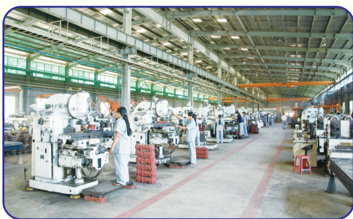
2003年9月,中国提供无息贷款建设的缅甸农机厂竣工。该农机厂年产16马力手扶拖拉机1万台、柴油机和旋耕机1万台、收割机5000台,可提供1300多个就业岗位。