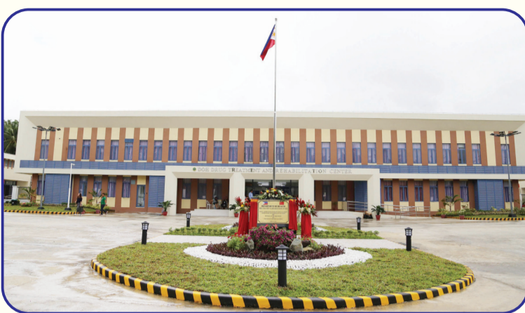
中国援菲律宾南阿古桑省戒毒中心占地面积约3公顷,总建筑面积6750平方米,于2019年4月揭牌。戒毒中心配备了治疗、培训、康复等设施,向菲南部地区的吸毒者提供康复治疗、毒品依赖性检测、咨询等多项服务。