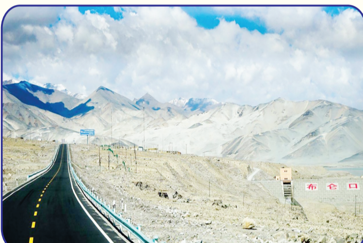
中国政府援建的巴基斯坦卡拉昆仑公路项目于1979年建成,1986年正式投入使用。这条公路被誉为“世界上最高最美的公路”和“世界第八大奇迹”。