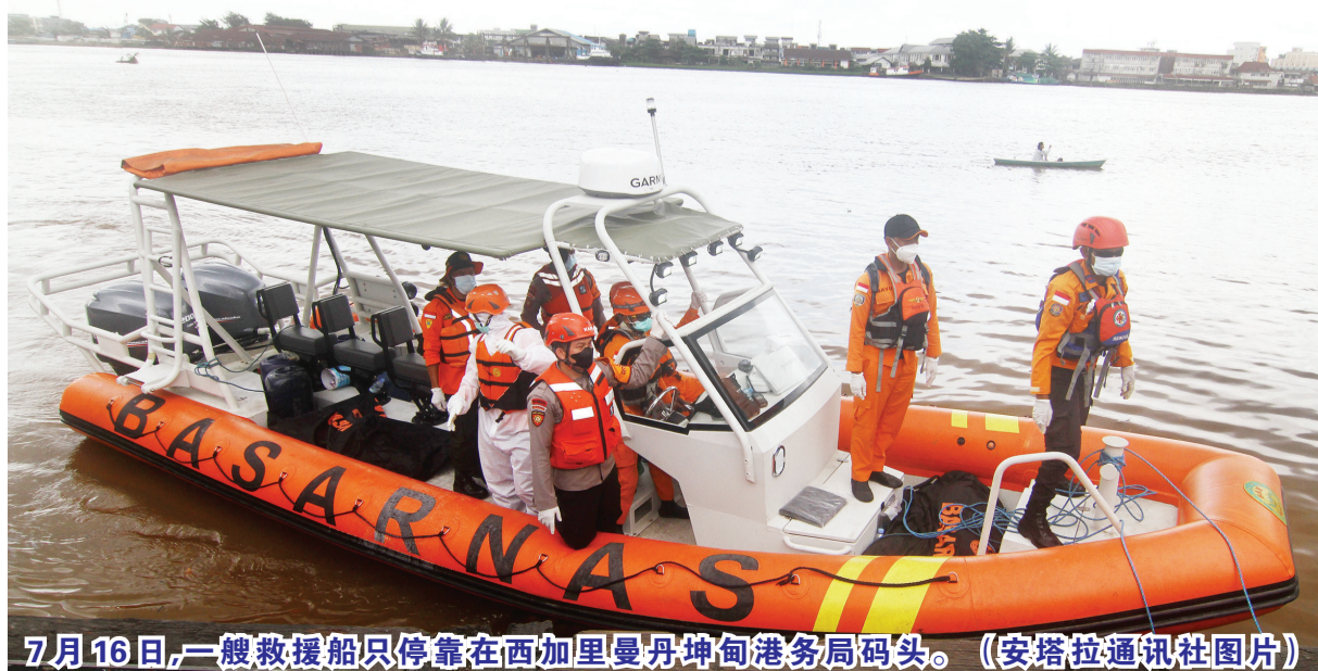
7月16日,一艘救援船只停靠在西加里曼丹坤甸港务局码头。

新华社雅加达7月21日电 印度尼西亚搜救官员21日说,印尼西加里曼丹省上周有多艘船只在热带风暴带来的大风和巨浪中倾覆,已造成24人死亡、31人失踪,目前搜救工作仍在进行中,希望能发现更多幸存者。西加里曼丹省坤甸搜救局负责人约皮在接受新华社记者电话采访时说,本月13日至14日,西加里曼丹省三发县遭遇热带