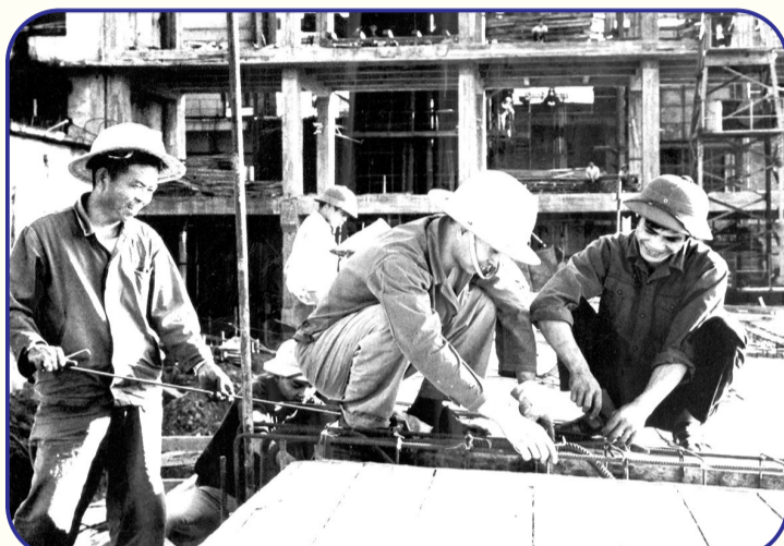
1976年,中国援建的越南北江氮肥厂竣工。该厂建筑面积3.3万平方米,年产6.5万吨氮肥,是越当时最大的氮肥厂。