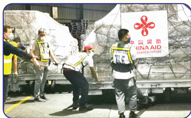
2020年3月,中国援助菲律宾的抗疫物资,由包机运载飞抵马尼拉。这些物资包括10万人份检测试剂、10万只医用外科口罩、1万只医用N95口罩和1万件医用防护服。