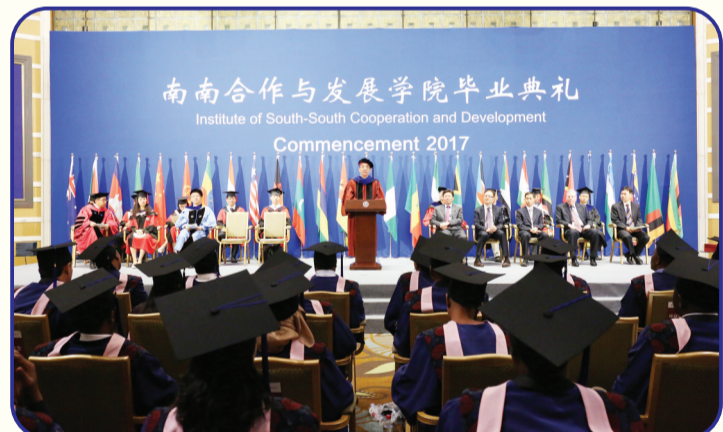
南南合作与发展学院是中国国家主席习近平宣布的重大对外援助举措,旨在总结分享中国及广大发展中国家治国理政成功经验,帮助发展中国家培养政府管理高端人才。图为2017年7月6日南南合作与发展学院举行首届毕业典礼。