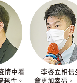
李啓立相信生活更加幸福。