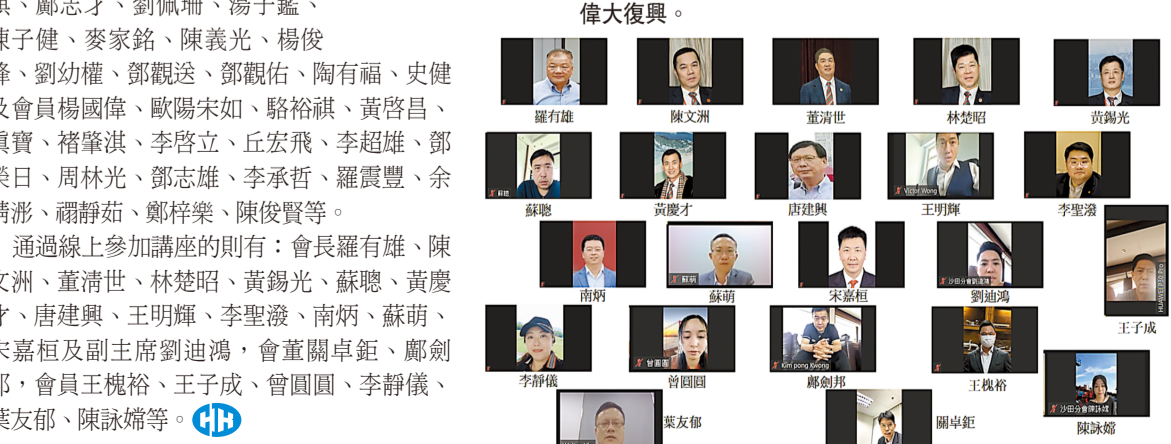
通過視訊參加座談會的同仁。