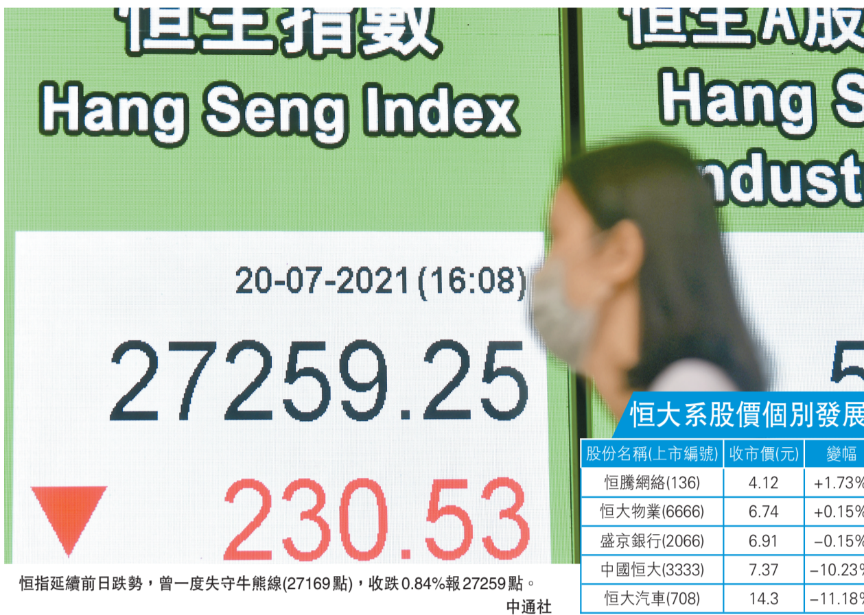
恒指連續前日跌勢，曾一度失守牛熊線(27169點)，收跌0.84%報27259點。中社

【香港商報訊】記者邱媛媛報道：市場憂慮疫情再度爆發打擊經濟，隔晚美道指插逾700點，加上恒大(3333)事件續發酵，昨日港股三大指數亦全線收跌，連跌第二日，累插745點或2.7%。