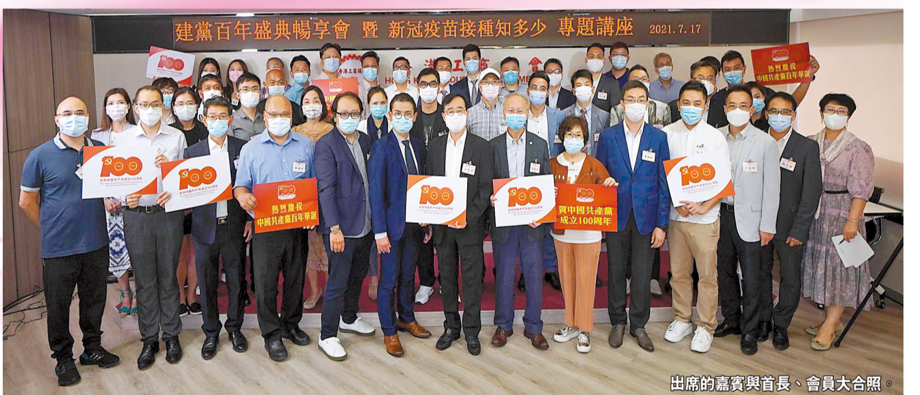
出席的嘉賓與首長、會員大合照。