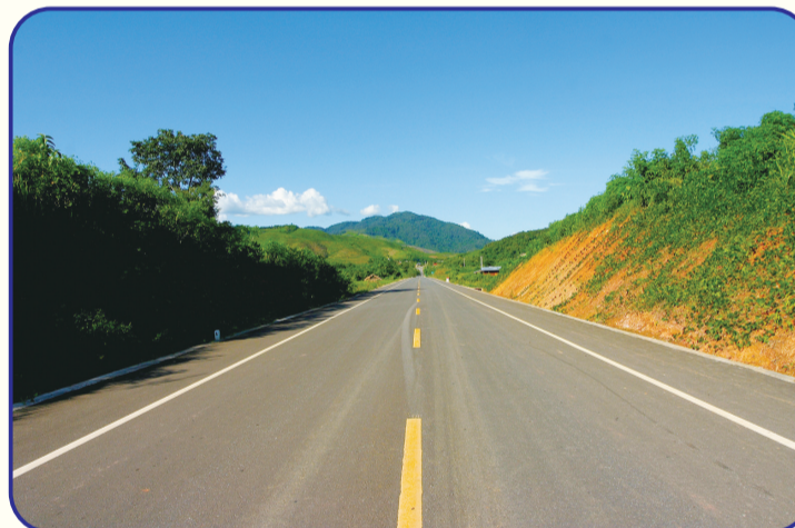
昆曼公路为大湄公河次区域合作南北经济走廊的关键部分,其中老挝境内路段全长240公里,由中国、泰国、亚洲开发银行共同援建。2006年6月,中国负责的86公里段竣工,2008年3月老挝境内路线全线通车。