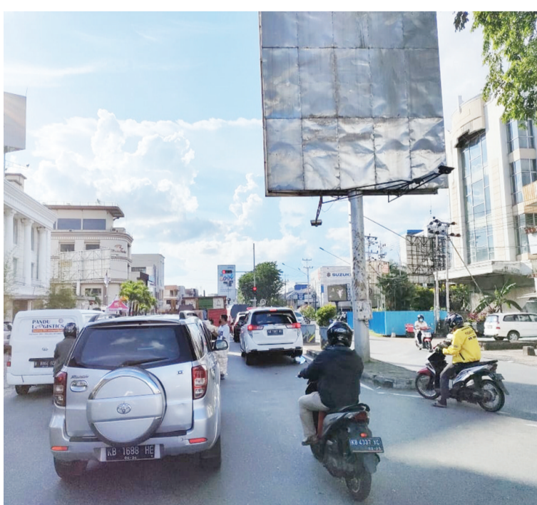
昨天 20/7 在 Garuda Hotel 交叉路街道交通繁忙情景

【本报坤甸讯】7月21日星期三,坤甸市长坎多诺前往西加省长办公楼会见西加省长苏塔尔米基,商讨坤甸市实行四级社区活动限制之事。坤甸市四级社区活动限制将加以延长,日期从2021年7月21日至7月25日。此事已载入2021年第23号内政部长指示中。在此之前,坤甸市社区活动紧急隔离已从2021年7月12日进行到7月20日。