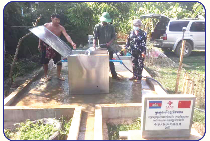
2017年以来,中国为柬埔寨磅清扬、波萝勉、磅士卑、柴楨等16个省乡村地区打深井约1800口,新建池塘约80座。大大改善了柬埔寨乡村地区供水条件。