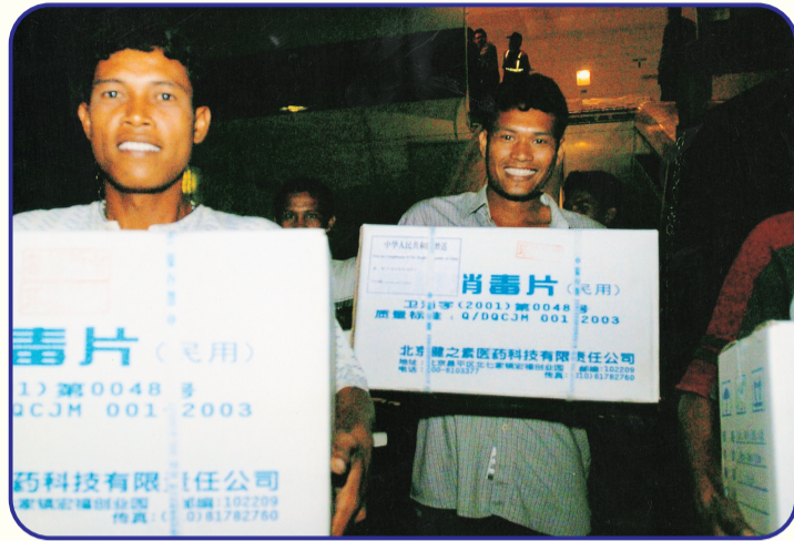
2004年12月,印度洋大地震和海啸给印度尼西亚、斯里兰卡、泰国、印度、马尔代夫等国造成巨大的人员伤亡和财产损失。中国通过多双边途径提供了总计近7亿元人民币的无偿援助,并在第一时间派出国际救援队赶赴灾区。图为中国政府提供的一批紧急救援物资抵达印度尼西亚北苏门答腊省,以及联合国利用中国资金给印尼受灾儿童提供书包。

北京峰会等重大国际场合宣布了一系列的对外援助举措,为破解全球发展难题,推动落实联合国2030年可持续发展议程提出中国方案,贡献中国智慧,体现大国担当。