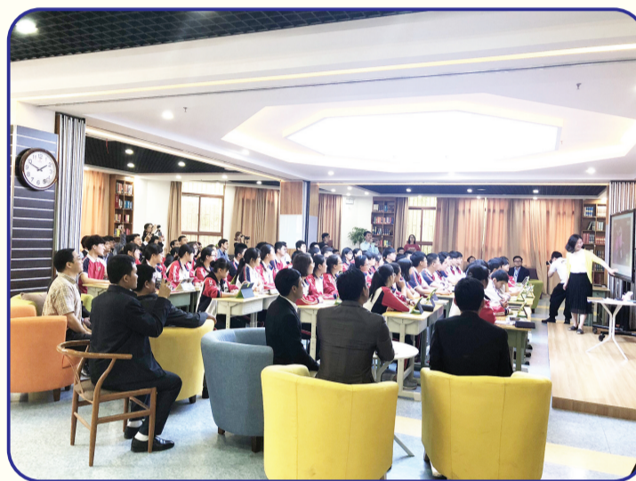
2018年5月,中国在湖南长沙实施柬埔寨教育数字化培训项目,共有38名官员参加。图为学员参观郑州七中信息化教育课堂。