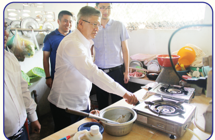
2018年11月,中国实施老挝沼气推广技术海外培训项目。图为老方代表在农户家中举行点火仪式。