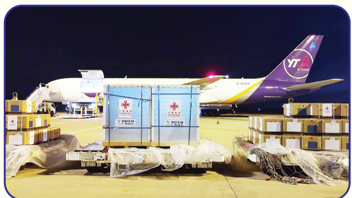
2021年2月8日,中国政府向老挝无偿援助的新冠疫苗运抵老挝首都万象瓦岱国际机场,老挝成为首批接受中国疫苗援助的国家之一。