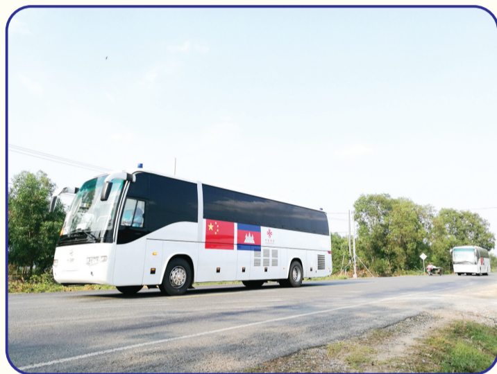
2018年,中国为柬埔寨提供40辆配备医疗设备的流动诊所车辆,满足儿科、普外科、妇产科、牙科、耳鼻喉科、X光、超声波等一般性检查和治疗需求。