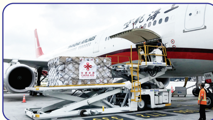
2020年3月,中国政府援助马来西亚的抗疫物资搭载包机抵达吉隆坡机场。