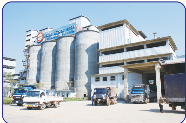
2002年3月,使用中国优惠贷款建设的老挝水泥厂二期项目竣工。该水泥厂年产水泥20万吨,采用世界先进的技术设备,使烟尘排放量降低98%。