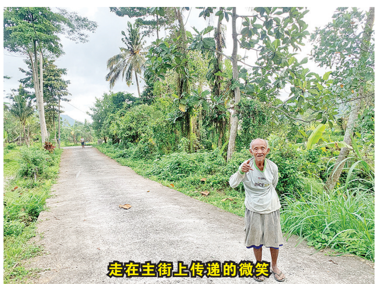
走在主街上传递的微笑

小企业参与跨境电子商务,随着越来越多的中小企业参与数字转型,将大大促进东盟与中国的贸易,跨境电子商务会愈演愈烈。 “通过这次论坛,我衷心希望我们能形成一致的意见,即数字发展将是一个强大的驱动力,鼓励我们的中小企业越来越多地参与数字平台,并加强东盟和中国之间的贸易。我十分期待见证中国—东盟如何在数字经济领域逐步推进双边合作。”周浩黎说。 (长江日报见习记者 郝天娇)