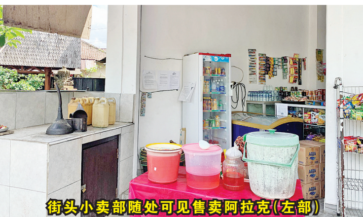
街头小卖部随处可见售卖阿拉克(左部)