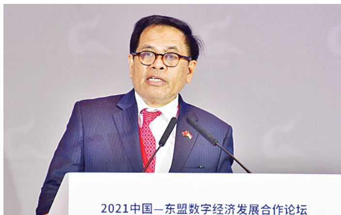
2021中国—东盟数字经济合作论坛 印尼驻华大使周浩黎。

资。由于武汉是中国重要的研究教育基地,武汉也是300多名印尼学生的家乡。同时我们也知道,武汉是全球数字经济创新的中心。因此,我认为武汉与印度尼西亚的合作有很大的空间和潜力,尤其在数字经济领域。” 据大使周浩黎介绍,印度尼西亚在数字经济领域有着巨大的潜力和光明的前景。“我们的电子商业交易额达到了440亿美元,数字经济达到了1300亿美元的规模,占印度尼西亚GDP总额的12%。同时,我们还拥有两亿多的人口,成立了许