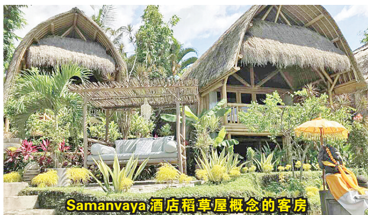
Samanvaya酒店稻草屋概念的客房