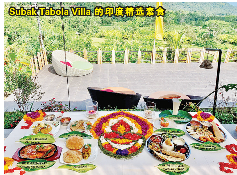
Subak Tabola Villa的印度精选素食

特不辣村走的就是“平衡路线”:喝酒享乐之际进行素食平衡!此地区以“素食天堂”著称,各餐厅或路边小摊都有相当美味的素食选择,或许是瑜伽过后为了寻求心理平衡吧! Subak