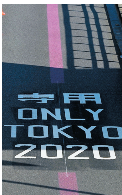
東京主要公路19日啓用東奧專用行車線。

日本政府在東京奧運開幕前兩個多星期，宣布東京都再次進入防疫緊急狀態，並取消奧運觀眾入場安排，推翻在6月中作出的決定，朝令夕改令奧運相關各方都被殺個措手不及。日本傳媒指出，日本首相菅義偉為求在大選前確立政績，凡事以奧運為先，對疫情及接種疫苗速度盲目樂觀，要為奧運開幕前的混亂局面負上最大責任。