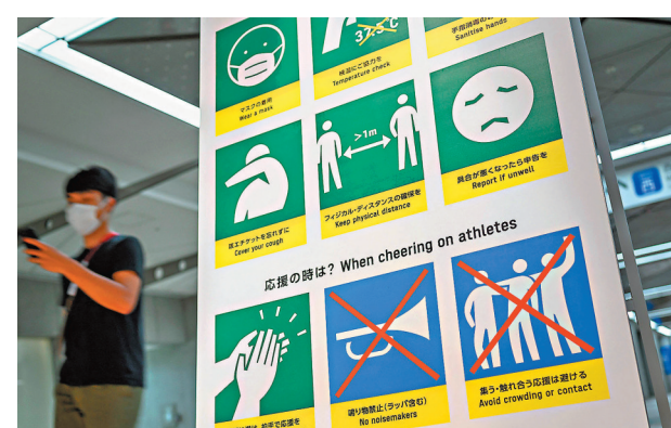
菅義偉政府對疫情盲目樂觀，被認為要為當前東奧亂局負主要責任。圖為奧運會場內的防疫標示。

目前菅義偉內閣的支持率已經跌至35%左右，接近傳統上30%的首相下台分界線，分析認為菅義偉已經失去執政自民黨內支持，相信黨內已經開始考慮人選，在眾議院大選中取而代之，菅義偉或會成為歷來任期最短的首相之一。