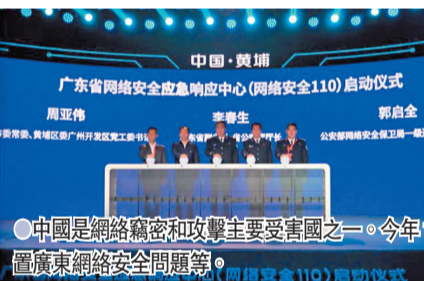
中國是網絡竊密和攻擊主要受害國之一。今年11月，廣東省啟動網絡安全應急響應中心，應對處置廣東網絡安全問題。(網絡安全110)啟動儀式