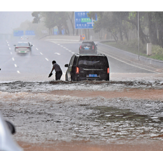
7月20日，受「查帕卡」影響，深圳遭遇強降雨。該市區低窪路面出現積水、車輛遇阻。