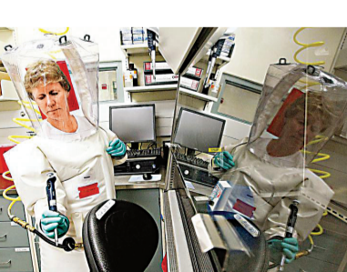
網民指出，德特里克堡實驗室存在多項違規行為。