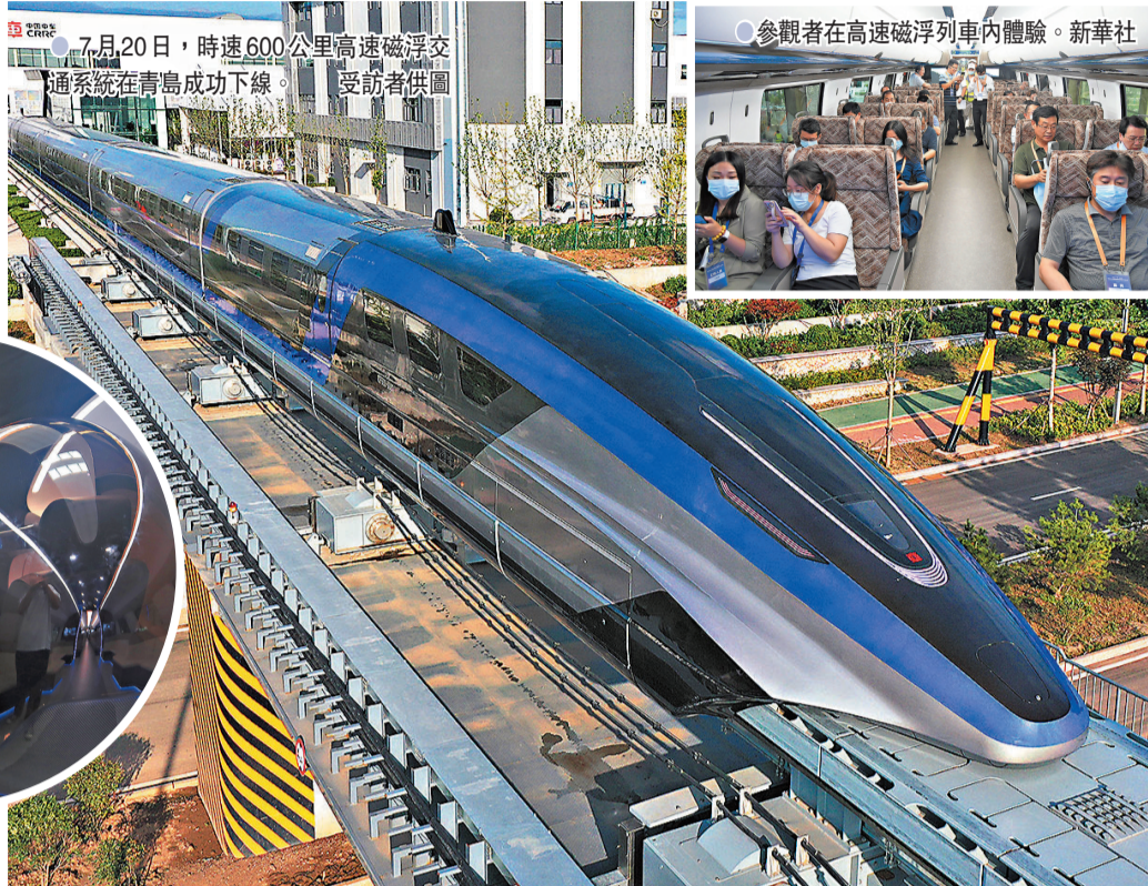
7月20日，時速600公里高速磁浮交通系統在青島成功下線。受訪者供圖