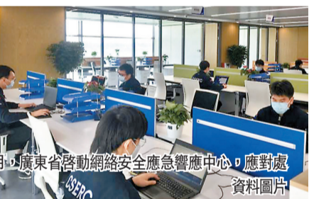
「黑客帝國」組團抹黑中國 用心惡毒