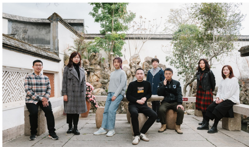
“真鸟团天团”部分成员合影。