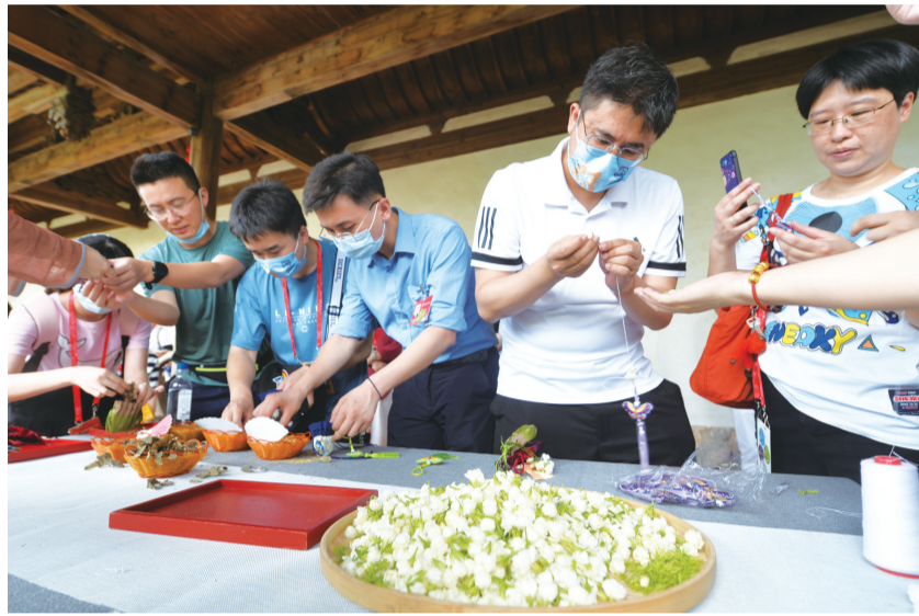
嘉宾们制作茉莉花串。