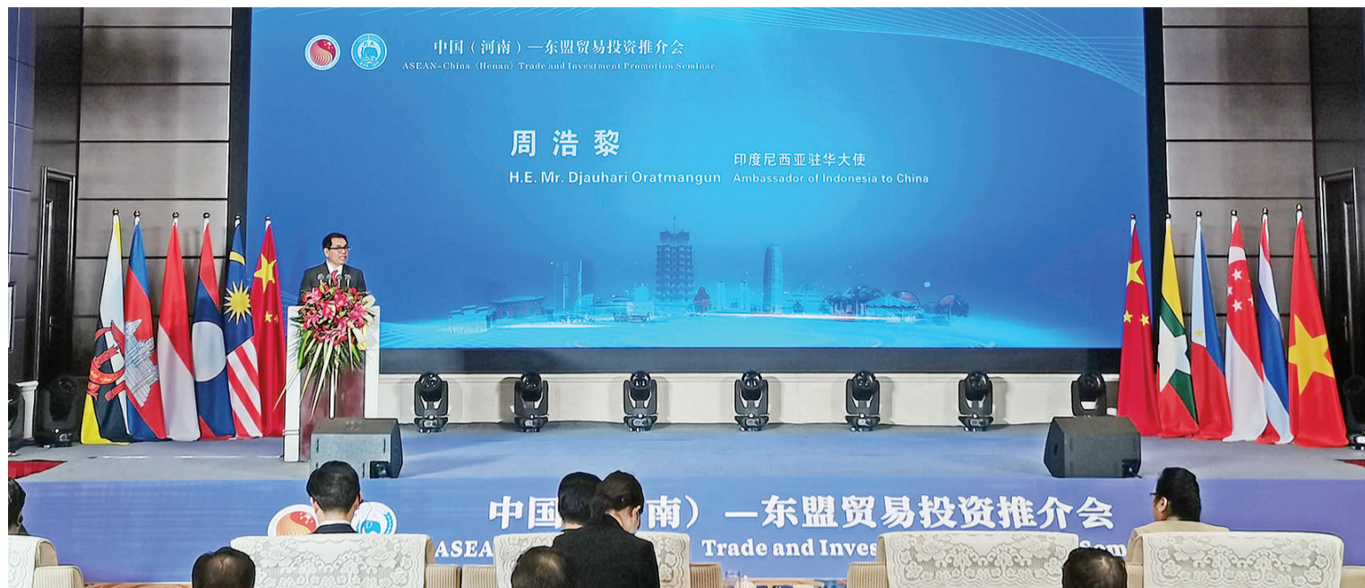
图为印度尼西亚驻华大使周浩黎在会上致辞

其间,印度尼西亚、柬埔寨、老挝、马来西亚、菲律宾、泰国等东盟多国商务专员,中方企业代表,在现场就各自投资优势进行了推介,并“一对一”现场解答。