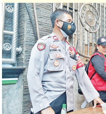
保安人员协助维持治安