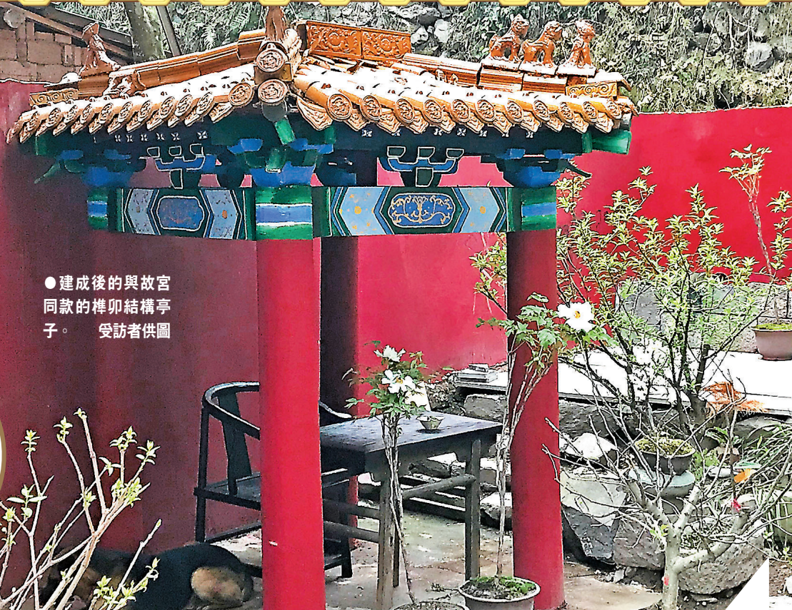
●建成後的與故宮同款的榫卯結構亭子。

榫卯是在兩個木構件上所採用的一種凹凸結合的連接方式，凸出部分叫榫（或榫頭），凹進部分叫卯（或榫眼、榫槽）。最基本的榫卯結構由兩個構件組成，其中的一個榫頭插入另一個卯眼中，使兩個構件連接並固定。榫卯結構是中國古代建築、傢具及其它木製器械的主要結構方式，是木件之間多與少、高與低、長與短之間的巧妙組合，可有效地限制木件向各個方向的扭動。榫卯是極為精巧的發明，這種構件連接方式，使得中國傳統的木結構成為超越了當代建築排架、框架或者鋼架的特殊柔性結構體，不但可以承受較大的荷載，而且允許產生一定的變形，在地震荷載下通過變形抵消一定的地震能量，減小結構的地震響應。1973年，距今六七千年的新石器文化遺址——浙江余姚河姆渡遺址中就發現了大量榫卯結構的木質構件。這些榫卯結構主要應用在干欄式的房屋的建造上，有凸型方榫、圓榫、雙層凸榫、燕尾榫以及企口榫等。