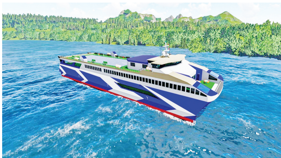
ITS 团队设计的轮船模型 MV Lanterna Karya