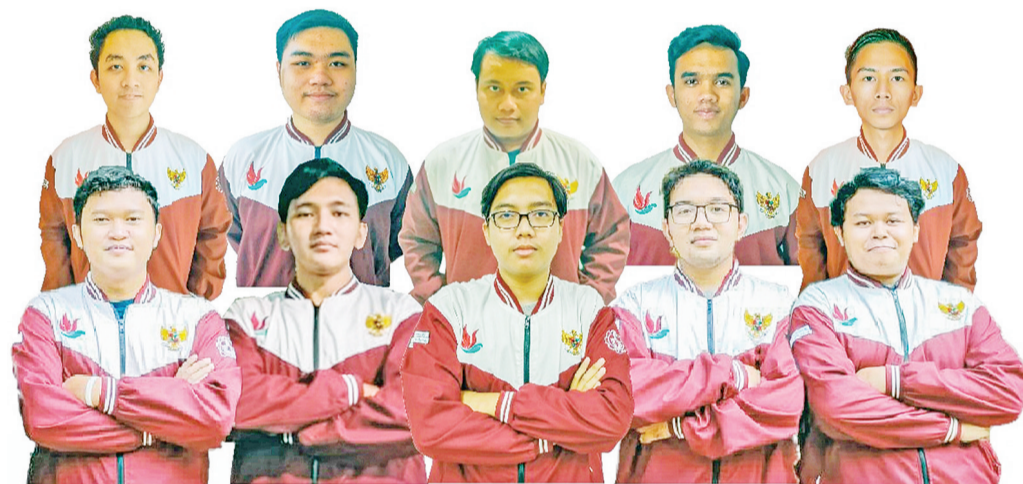
ITS Nawasena 团队合影