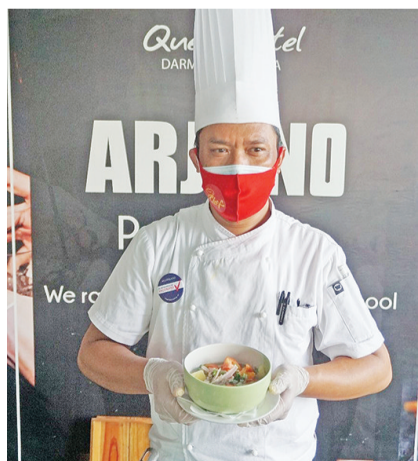
厨师展示山羊肉汤菜谱