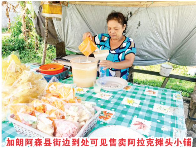
加朗阿森县街边到处可见售卖阿拉克摊头小铺