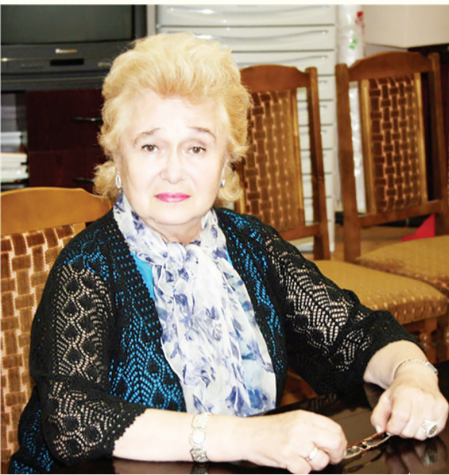
俄中友好协会第一副主席加林娜·库利科娃

她是俄罗斯中国友好协会第一副主席。从青丝袅袅到暮雪苍苍,她热爱中国的心从未改变,至今仍在为中俄友谊努力工作。新中国成立七