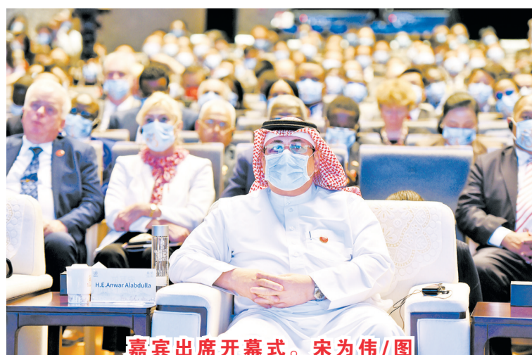
嘉宾出席开幕式。