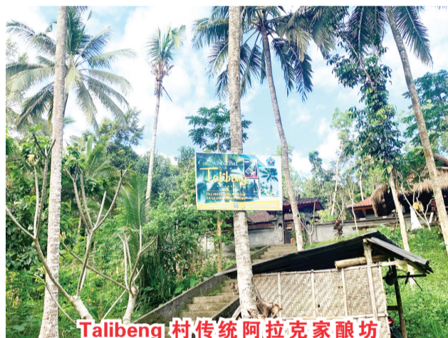
Talibeng村传统阿拉克家酿坊