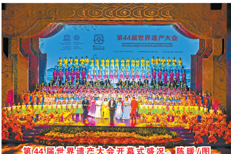
第44届世界遗产大会开幕式盛况。

激动地引吭高歌,唱起自己国家的国歌,现场洋溢着愉快轻松的氛围。 “这是我第二次来福州。福州是个很棒的绿色城市,福建也是一个拥有众多文化遗产和丰富饮食文化的中国省份。和联合国教科文组织的与会嘉宾一起参加世遗大会是一次很有意义的体验,世遗大会在福州举办对未来中国的发展具有深远意义。”冰岛驻华大使古士贤说。 (管澍 林双伟)