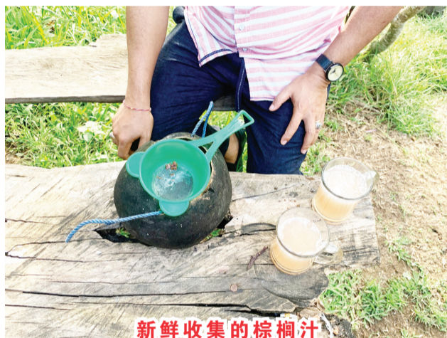
新鲜收集的棕榈汁