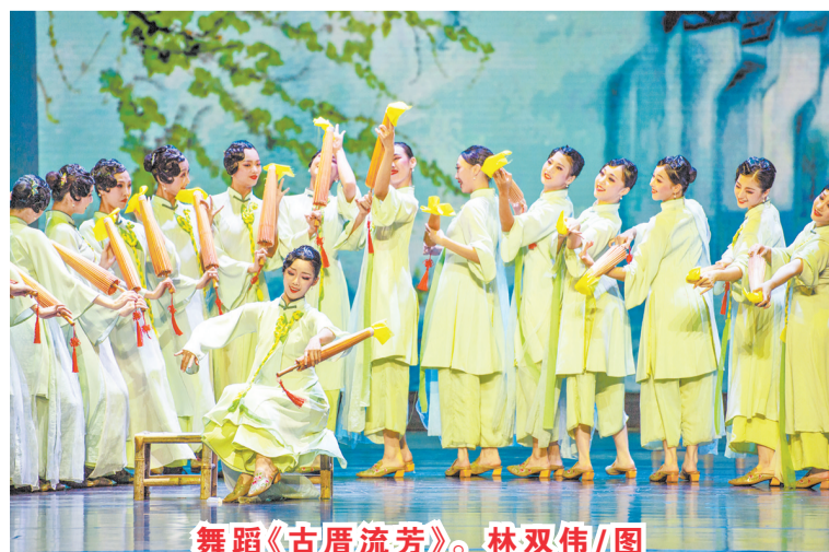
舞蹈《古厝流芳》。