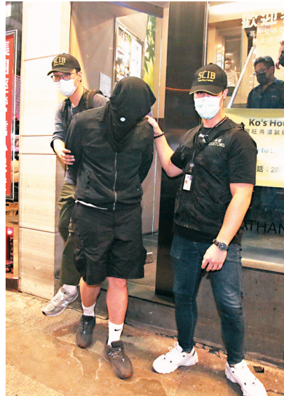
海關動員40名財富調查課人員突擊搜查全港5個處所，以涉嫌「洗黑錢罪」拘捕4名男子。

被捕 4名男子年齡介乎24歲至33歲，其中報稱「自僱人士」的33歲男子為洗黑錢集團骨幹，其餘3人分別報稱保險從業員、建築工人及健身教練。據悉，該集團骨幹去年初以每月1萬至2萬元作為報酬，招攬該3名男子開設報稱經營運輸、紅酒及健康食品貿易的3間公司，並出任「傀儡」董事，同時在一個本地虛擬貨幣交易平台開設電子錢包，並在本地多間銀行開設戶口。