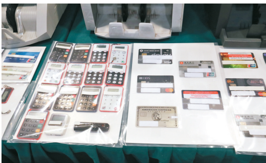
海關人員檢獲多部電話、電腦、銀行月結單、銀行保安編碼器、公司印章等，並凍結疑犯2,000萬元銀行存款。