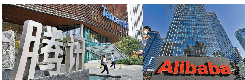
騰訊和阿里巴巴傳出正考慮逐步對彼此開放服務，市場認為兩大巨頭合作，雙方均得資料圖片

訊、字節跳動、華為、京東、科大訊飛等33家互聯網企業，共同簽署《互聯網平台經營者反壟斷自律公約》。報道指，該《公約》主要以維護市場公平競爭秩序、重視消費者福利保護、加強自主創新為原則，倡議各互聯網企業積極推進行業自律，共同創造良好行業競爭環境。