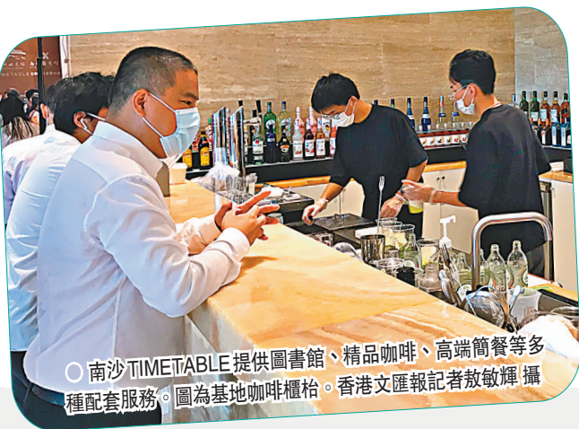
○南沙TIMETABLE提供圖書館、精品咖啡、高端簡餐等多種配套服務。圖為基地咖啡櫃檯。