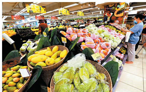
▲衛生紙、面紙過去30天最高漲價25%。