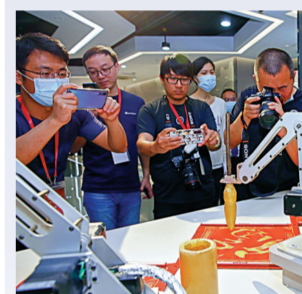
中央支持浦東打造世界級創新產業集群，力圖人工智能領域突圍而出。