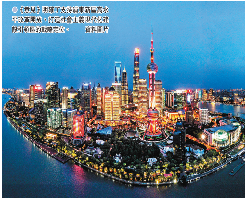
《意見》明確了支持浦東新區高水平改革開放、打造社會主義現代化建設引領區的戰略定位。資料圖片

到2025年建成現代化國際化創新型城市；到2035年建成具有全球影響力的創新創業創智之都；是到本世紀中葉成為競爭力、創新力、影響力卓著的全球標杆城市