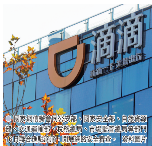
國家網信辦會同公安部、國家安全部、自然資源部、交通運輸部、稅務總局、市場監管總局等部門16日聯合進駐滴滴，開展網絡安全審查。資料圖片

三是在常態化監管基礎上，對前期整治出現的問題開展回頭看，針對重點問題、重點企業，建立台賬和責任清單制度，尤其是對於反覆出現的、老百姓比較關心的問題，必須加大懲處力度。對於整改不到位、落實效果不好的，要在整治基礎上納入信用管理。