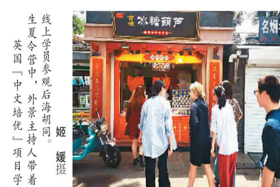
线上学员参观后海胡同,英国“中文培优”项目学生夏令营中,外籍主持人带着