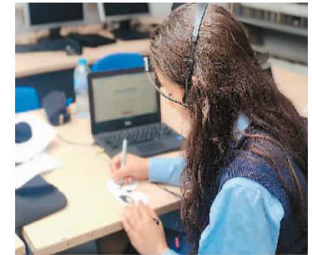
英国“中文培优”项目夏令营“大熊猫园”线上主题教学活动,学员在创作。