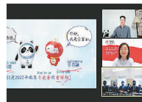
英国“中文培优”项目学生夏令营“冬奥盛会”线上主题教学活动视频截图。

据悉,培优项目是由英国政府发起并出资支持,由英国文化教育协会、伦敦大学学院联合中国教育部中外语言交流合作中心主办,旨在培养优秀中文人才的项目。作为该项目的重要环节,每年英国培优项目中学生会在掌握一定中文基础后,参加访华夏令营进行集中研修。受新冠肺炎疫情影响,今年夏令营通过线上平台举办。