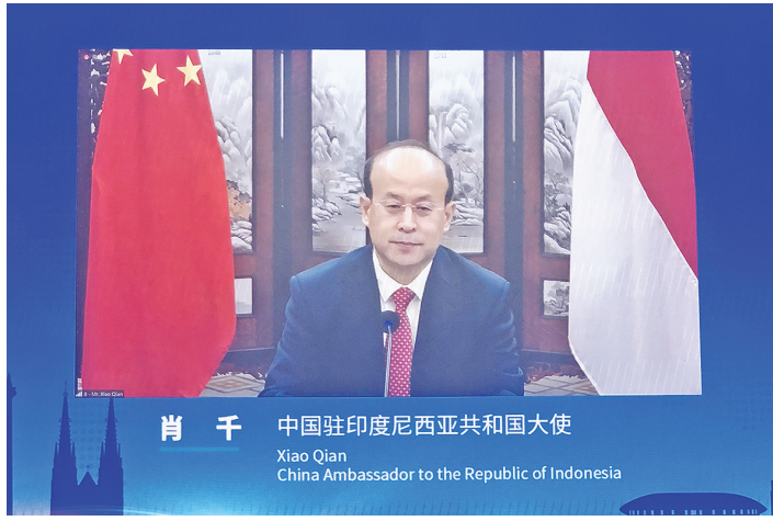
肖千大使指出，“两国双园”项目将是“一带一路”和“全球海洋支点”战略对接走深走实一个新的重要载体。

肖千大使在致辞中表示，当前新冠疫情形势下，双方以线上线下相结合的方式联合举办此次活动，彰显了中印尼携手抗疫、共克时艰的坚定信心，也反映出双边经贸关系的强大韧性。