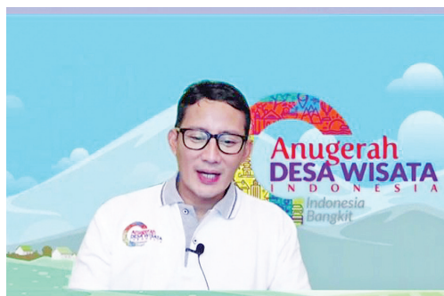
善迪亚卡部长主持开讲礼

旅游和创意经济部长善迪亚卡，在为B区(NTB、NTT、加里曼丹、苏拉威西、哥伦打洛、马鲁古、北马鲁古、巴布亚和西巴布亚)主持“2021年印尼旅游村奖