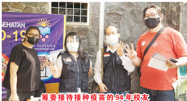
筹委接待接种疫苗的94年校友