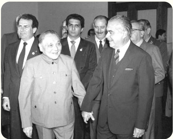
邓小平(左)在北京人民大会堂会见时任巴西总统萨尔内

1988年,时任巴西总统萨尔内在访华时同邓小平进行了一场“世纪对话”,让南南合作的纽带跨越半球,留下一段“相知无远近,万里尚为邻”的历史佳话。