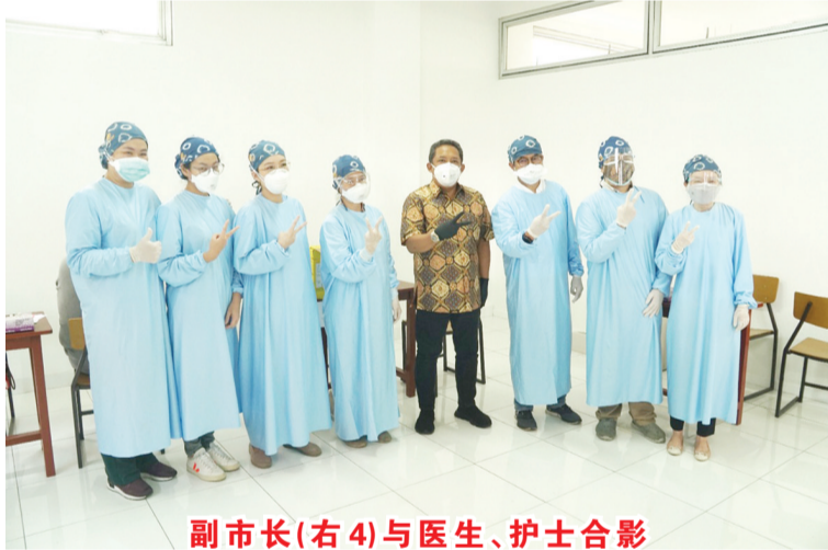
副市长(右4)与医生、护士合影

【本报万隆讯】为响应万隆市府抗疫举措,万隆“阿来修斯”(Santo Aloysius)基督教学校,日前为18岁以上校友及民众接种疫苗。