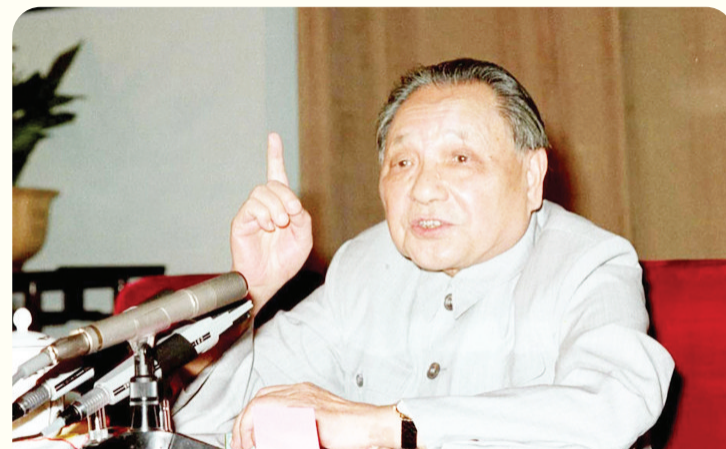
1985年至1987年底期间,在时任中央军委主席邓小平的领导下,中国人民解放军减少员额100万

在国际事务中的沟通与协调更加密切。双方在能源、金融、基础设施建设等领域的重大合作项目稳步推进。两国在联合国、世贸组织、二十国集团、金砖国家等国际组织和多边机制中保持良