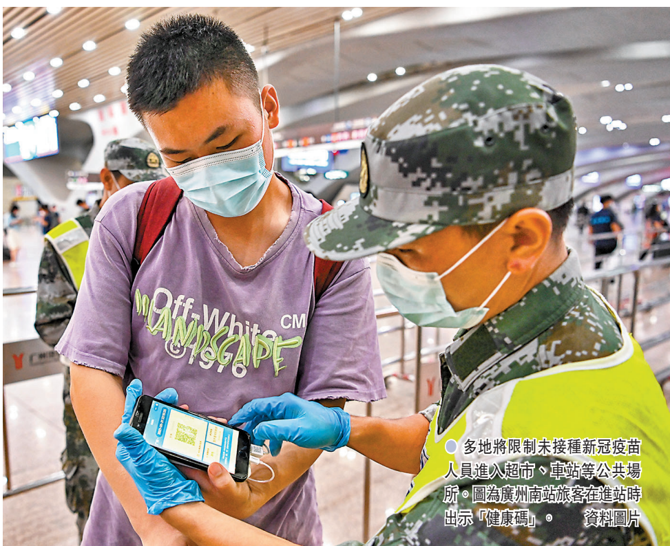
●多地將限制未接種新冠疫苗人員進入超市、車站等公共場所。圖為廣州南站旅客在進站時出示「健康碼」。

媒體查詢發現，部分發文地區目前的疫苗接種率並不理想。以贛州為例，截至6月30日，贛州