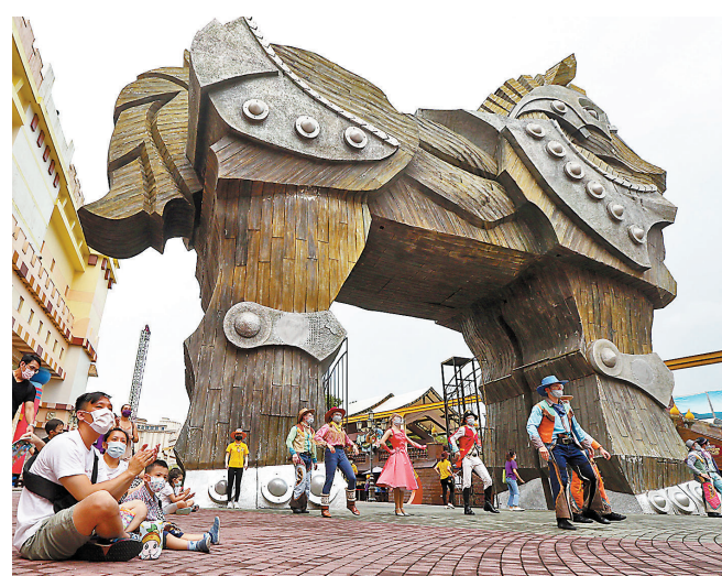
●台灣實施「微解封」首日，各風景區暫未湧入大量人潮。圖為家長帶孩子到高雄義大遊樂世界遊玩。

不少媒體此前針對「微解封」所作民調顯示，反對聲量遠高於支持聲音，原因集中在「不急於此時」、「沒疫苗打，很快又會淪陷」、「隱形傳播鏈或擴大感染，提升疫苗接種率才能解封」等。