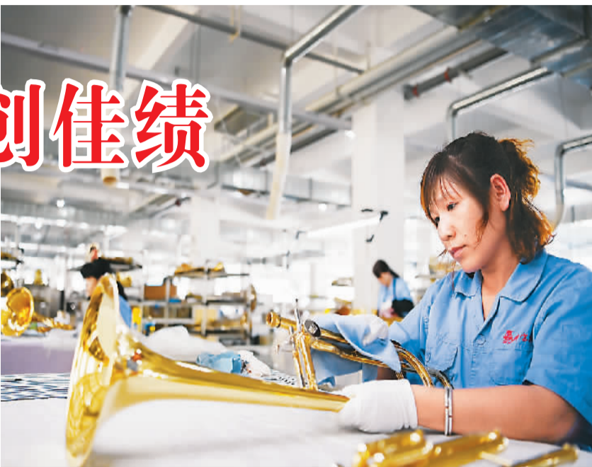
天津市津宝乐器有限公司可生产打击乐器和管乐器成品及零件在内的400余种产品，产品出口全球数十个国家和地区。图为员工在该公司车间组装小号。

拓市场、增订单、降成本、强研发……近年来，民营企业进出口表现突出。数据显示，上半年，中国民营企业进出口8.64万亿元，增长35.1%，占外贸总值的47.8%，