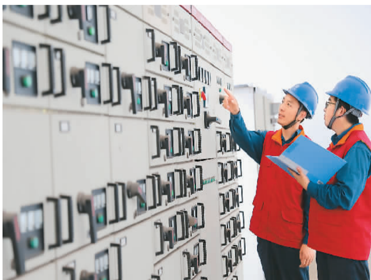
山东东营港经济开发区高标准编制电力专项规划，在电网建设、供电可靠性、办电便利度等方面推出扎实举措，促进经济发展。今年上半年，国网东营港供电中心完成售电量超150164万千瓦时，同比提高29.21%。图为7月13日，工作人员在落实电力专项规划。

京东集团技术委员会主席周伯文表示，此次云操作系统的发布，正是京东通过扎实的基础设施、领先的数字化供应链、创新的人工智能、云计算、区块链等技术服务能力，以助推其他实体经济高质量发展的最新探索。