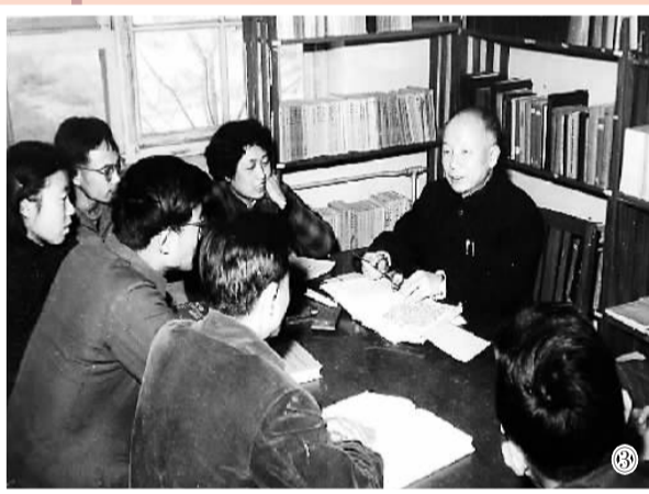
图③: 物理学家钱临照正在为学生答疑。