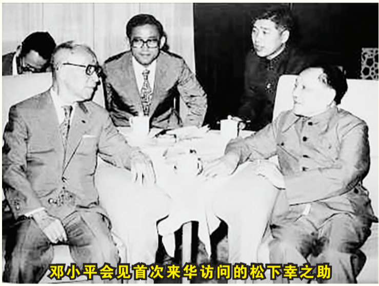
邓小平会见首次来华访问的松下幸之助

君子间的约定,四十余载初心不改。邓小平与松下幸之助的“君子之约”是中日友好交往的精彩剪影,是中国改革开放加速发展的重要助力,是中国共产党人谦虚务实、奋勇开拓的有力见证。时至今日,松下集团同中国仍有着良好合作,续写着中日友好新篇章。面向未来,中国将继续敞开胸怀,打造世界舞台,诚邀国际友人,谱写更多“君子之约”。