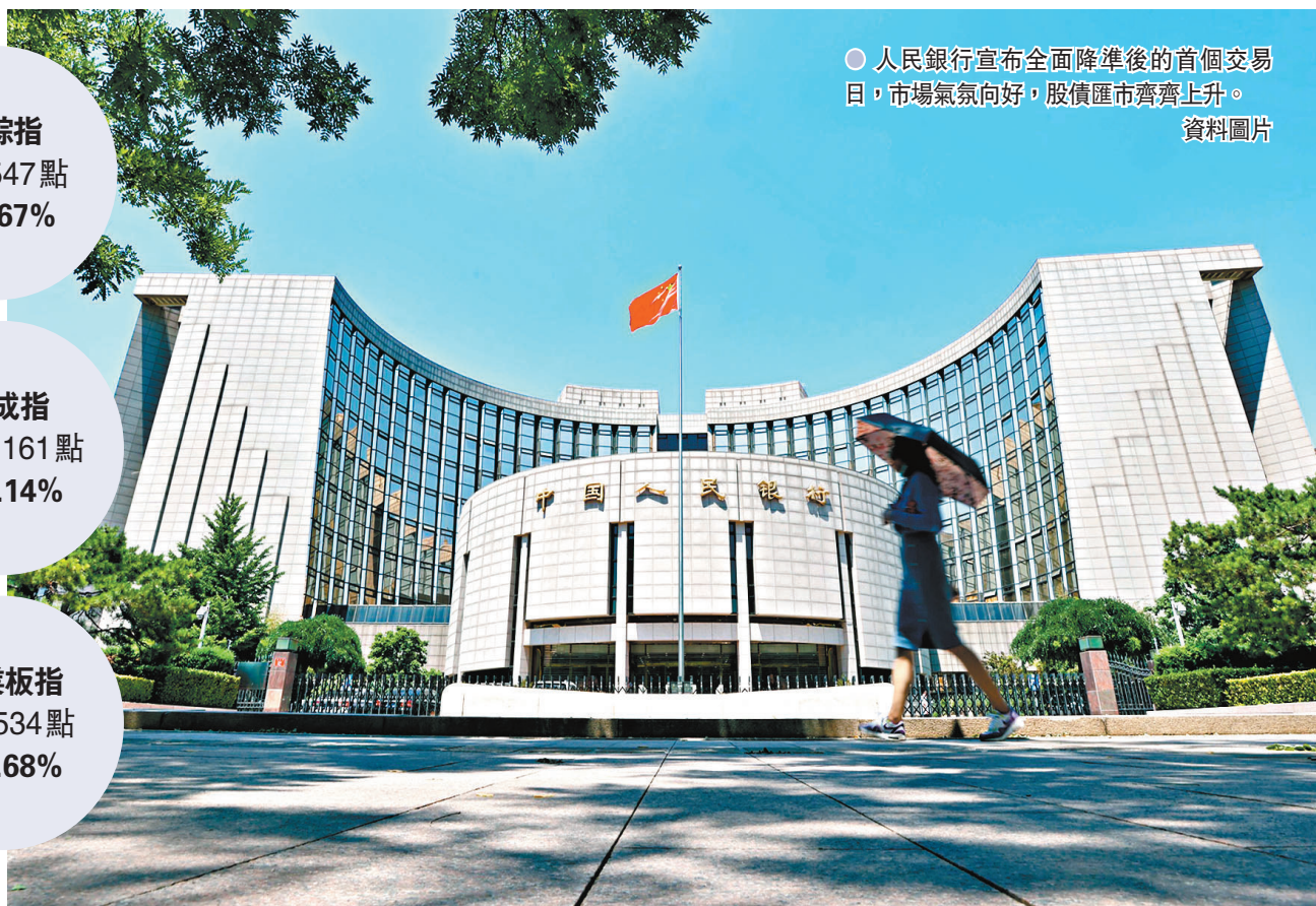
●人民銀行宣布全面降準後的首個交易日，市場氣氛向好，股債匯市齊齊上升。

降準鞏固和提振了投資者對A股成長板塊的偏好。創業板全日成交額為3,097億元（人民幣，下同），有126隻股票的換手率超過一成，723隻股票收盤報漲。科創50指數也漲1.13%，至1,601點。農銀匯理基金認為，此次降準操作釋放了貨幣政策寬鬆的信號，打消市場對資金面的擔憂，友好的流動性環境將對股票的估值形成支撐，風格上中小市值成長板塊更加受益。