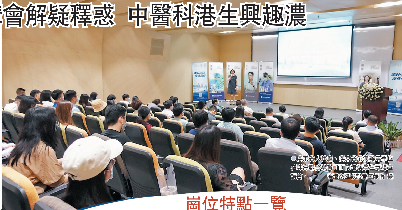
●廣東省人社廳、廣東省港澳辦等單位在珠海聯合舉辦了面向港澳學生專場宣講會。