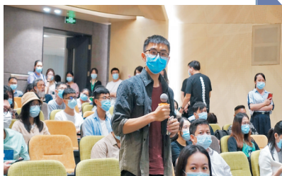
●廣東省人社廳等有關部門面對面為港澳學生答疑。