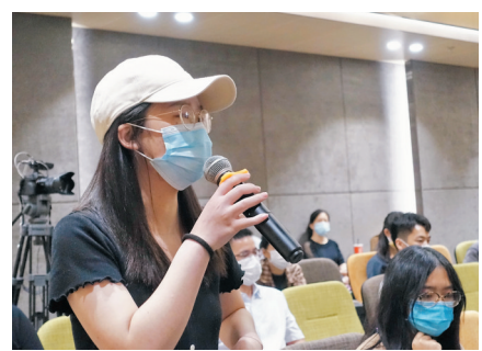
●宣講會氣氛非常火爆，不少港澳學生踴躍提問，以期了解更多報考資訊。

對於不少在內地就讀中醫學科的港生來說，考取事業單位是一個不錯的選擇。但前提條件是，港生需完成3年的住培醫師規範化培訓並取得證書後才能報考。「很多人因為執業資格證的問題選擇回港工作，但這兩