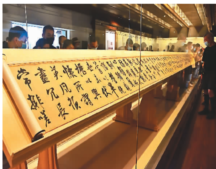
图为观众参观“万年长春：上海历代书画艺术特展”。

执纪者必先守纪。在极端困难和白色恐怖笼罩的情况下，第一届中共中央监察委员会10名委员无一变节。其中8人先后牺牲在刑场或战场上，1人在战争年代下落不明，最终只有1人看到了中华人民共和国的成立。这支纪检监察铁军以自己的行动，履行了对党组织的铮铮誓言，书写了共产党员的无悔忠诚。