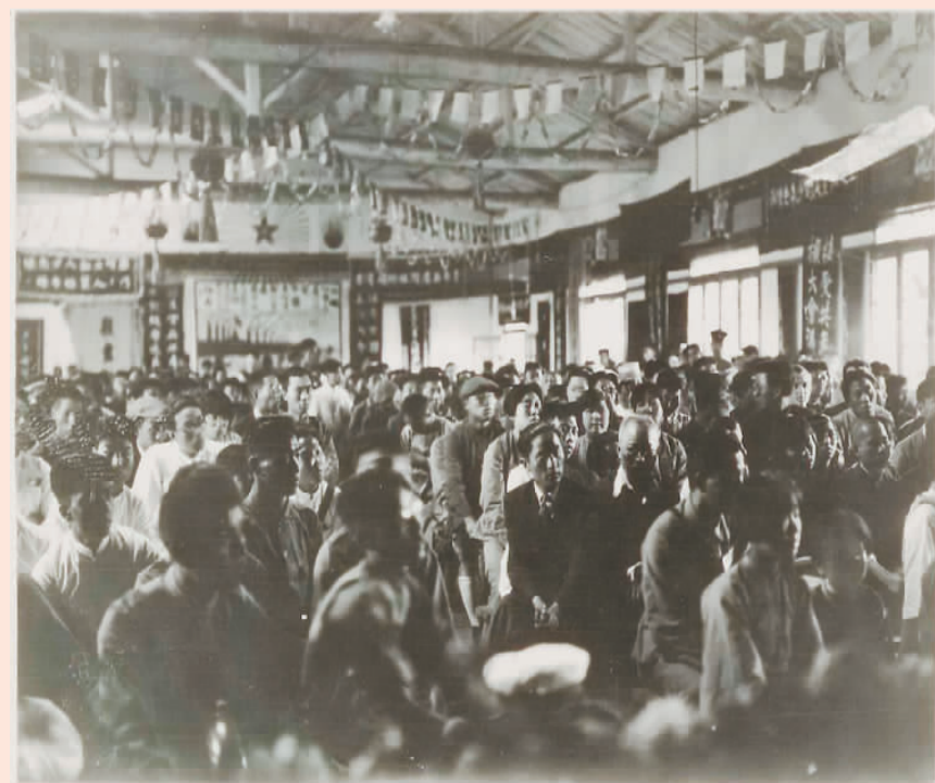
中共五大现场照片（复制件）。

展览中可以看到新中国发现的第一块铀矿石标本、青海石油勘探局1956年献给周恩来总理的原油样本“柴达木之宝”、世界上首次发现的中华龙鸟化石、中国第172个独立矿种——页岩气的标本等。