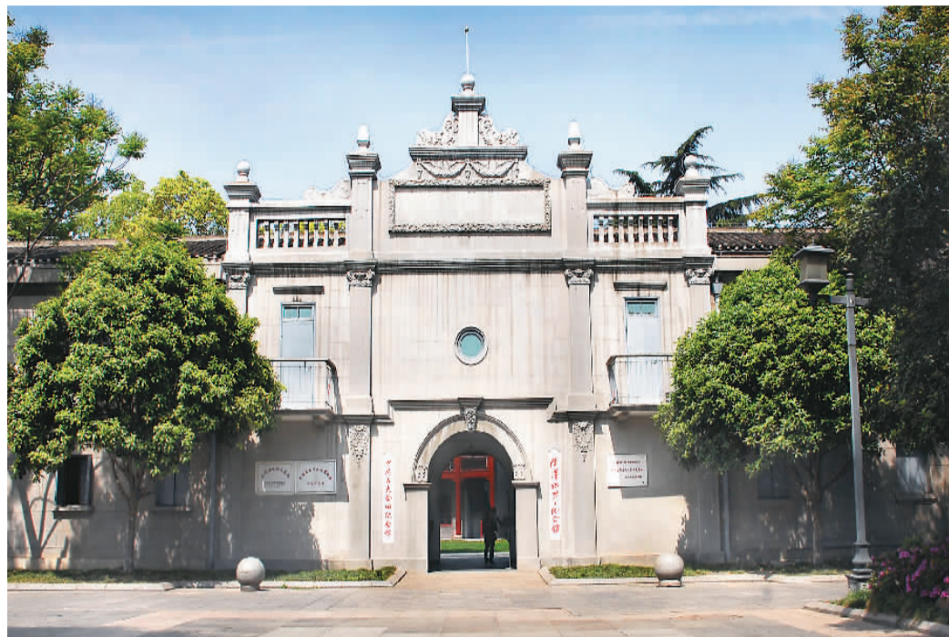
中共五大会址纪念馆。

武汉革命博物馆下辖中共五大会址纪念馆、武昌中央农民运动讲习所旧址纪念馆、毛泽东旧居纪念馆、中国共产党纪律建设历史陈列馆、起义门旧址纪念馆等革命旧址和红色场馆，是武汉最负盛名的红色文化圣地。 走进红巷，青砖灰瓦的檐墙、苔藓青石的路面、光影摇曳的大树，仿佛都在诉说那段风雷激荡的峥嵘岁月。